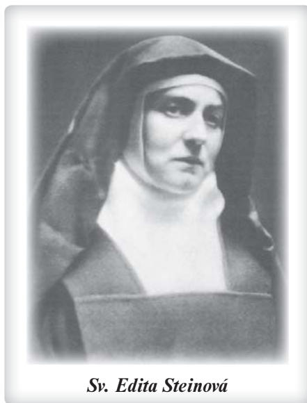
Sv. Edita Steinová

Tentýž Bůh, který původně nechtěl utrpení, nás nyní prosí, abychom bolest, nemoc a smrt přijali v lásce jako on, abychom je nesli ve sjednocení s ním a přiná-