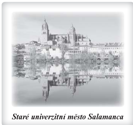
Staré univerzitní město Salamanca