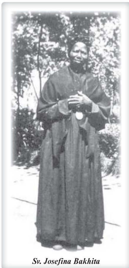
Sv. Josefina Bakhita

Kdo chce svůj život zaměřit na Boží vůli, ale zdánlivě nedostává na svoji otázku žádnou odpověď, ten může jako útěchu přijmout tato slova: Budeš-li upřímně a z celého srdce říkat: „Otče, buď vůle tvá jako v nebi, tak i na zemi!“ – tehdy si můžeš být jistý, že Bůh i přes tvoji sla-