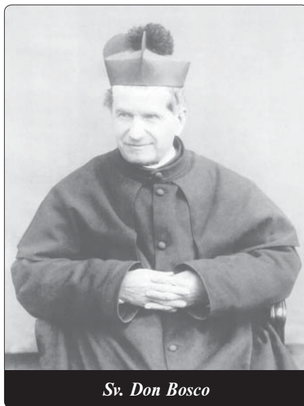
Sv. Don Bosco