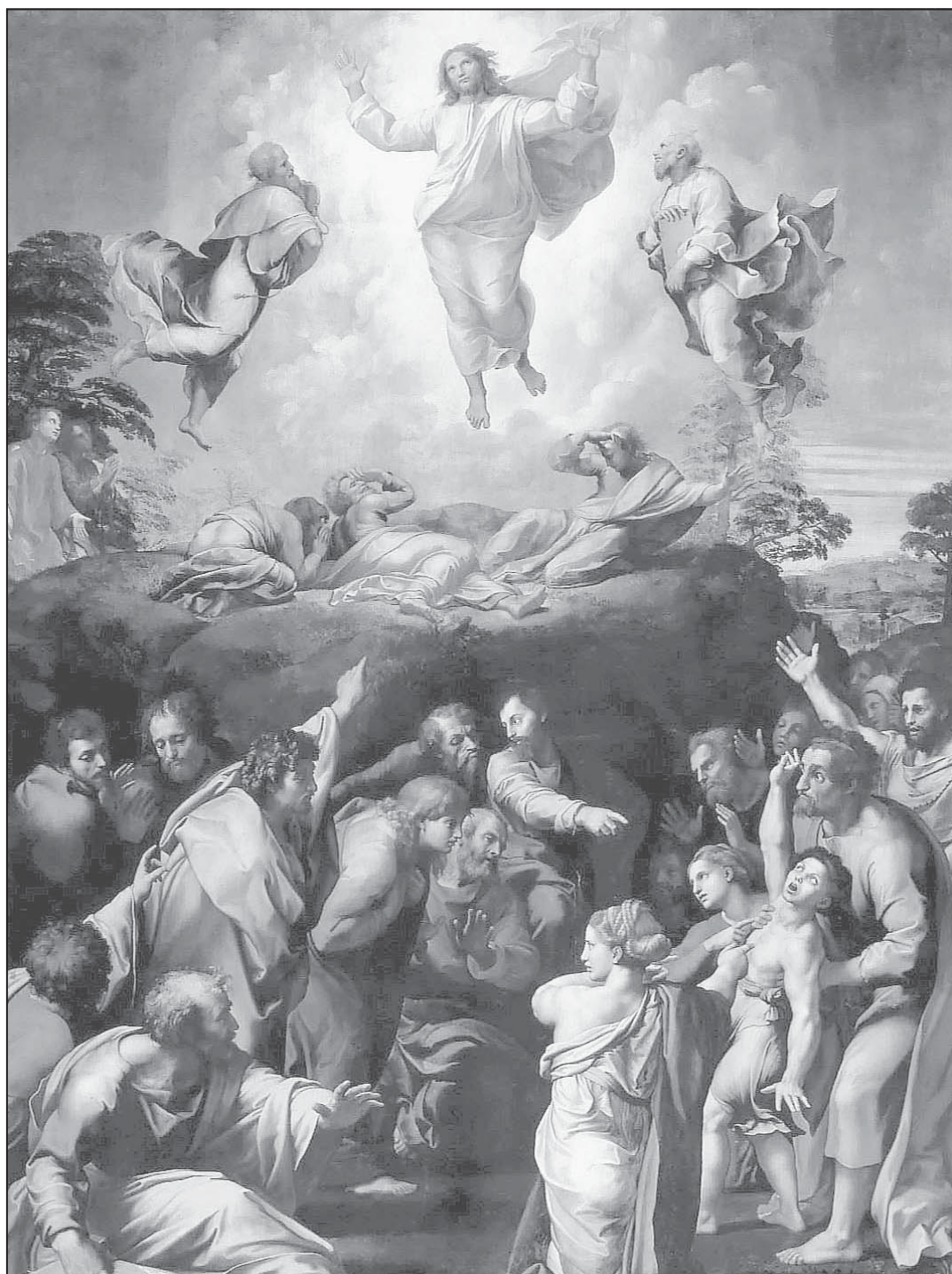
Rafael Santi (1483 - 1520): Proměnění Páně