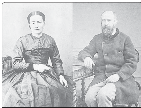
Marie-Azélie (Zélie) Guérinová Martinová (1831–1877) a Ludvík Martin (1823–1894)