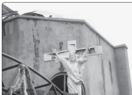
Kostel v Madalle (Nigérie), který byl zničen v roce 2011 během jitrní mše svaté. Původcem byla pravděpodobně islamistická teroristická skupina „Boko Haram“. V tomto roce padlo za obětí útokům islamistů už více než 2500 křesťanů a umírněných muslimů.

Svatý Maxmilián Kolbe byl po celý svůj dlouhý život horlivým misionářem jako věrný syn bez poskvrny počaté Panny Marie a Matky Boží. V průběhu svého pobytu na studích v Římě musel vidět církvi nepřátelskou demonstraci svobodných zednářů a založil potom „Rytíře neposkvrněné“. V Polsku a v Japonsku vytvořil tehdy vlastní město, které se věnovalo cele apoštolátu pod ochranou Neposkvrněného Početí. Otec Maxmilián byl nakonec kvůli své misijní činnosti zatčen a dopraven do Osvětimi. Tam se přihlásil, že půjde místo jiného vězně do bunkru