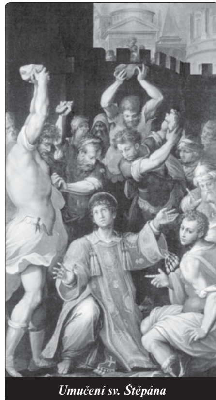
Umučení sv. Štěpána

I když nejláhodnější Panna a Matka Boží Maria nezahynula mučednickou smrtí, vyzýváme ji v loretánské litanii jako Královnu mučedníků, protože Mariin život byl jediným svědectvím pro jejího Syna. Vzpomeňme si na obtíže v Betlémě při hledání přístřeší a na útěk do Egypta. Dalším důvodem pro království Matky Boží nad mučedníky je prorockví Simeonovo v chrámě v Jeruzalémě, které se vztahuje na svědectví života Ježíše a na bolesti Marie při smrti svého Syna: „Toto dítě je určeno k pádu i povstání mnohých v Izraeli; má být znamením, jež muž se bude odpírat – a tvou vlastní duší probodne meč!“ (Lk 2,34–35) Maria