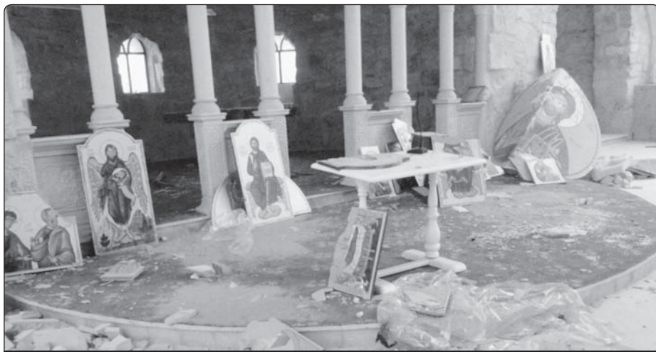
Stopy zpusťování v Homsu (Sýrie). Rostoucí vliv radikálních islamistů v sýrské občanské válce výrazně zhoršil situaci křesťanů.

Štěpán (Sk 7) se přiznává v jednom kázání ke Kristu jako k pravému Bohu a jedinému Vykupiteli a byl za to ukamenován. Vydal tím svědectví pro Krista svými slovy a svojí smrtí. Štěpán následoval jako první příklad Ježíše Krista: „Kdo nebere svůj kříž a nejde za mnou, není mě hoděn.“ (Mt 10,38) Svatý Štěpán se modlí stejně jako Ježíš za své vrahy a dává nám tím příklad Ježíšem požadované lásky k nepřátelům. Takový hrdinský čin bychom mohli uskutečnit jenom s pomocí milosti Trojediného Boha. Svojí modlitbou způsobí Štěpán Saulovi milost obrácení a potvrdí slova Ježíšova: „Nezemře-li obilné zrna padlé do země, zůstává samo; zemře-li