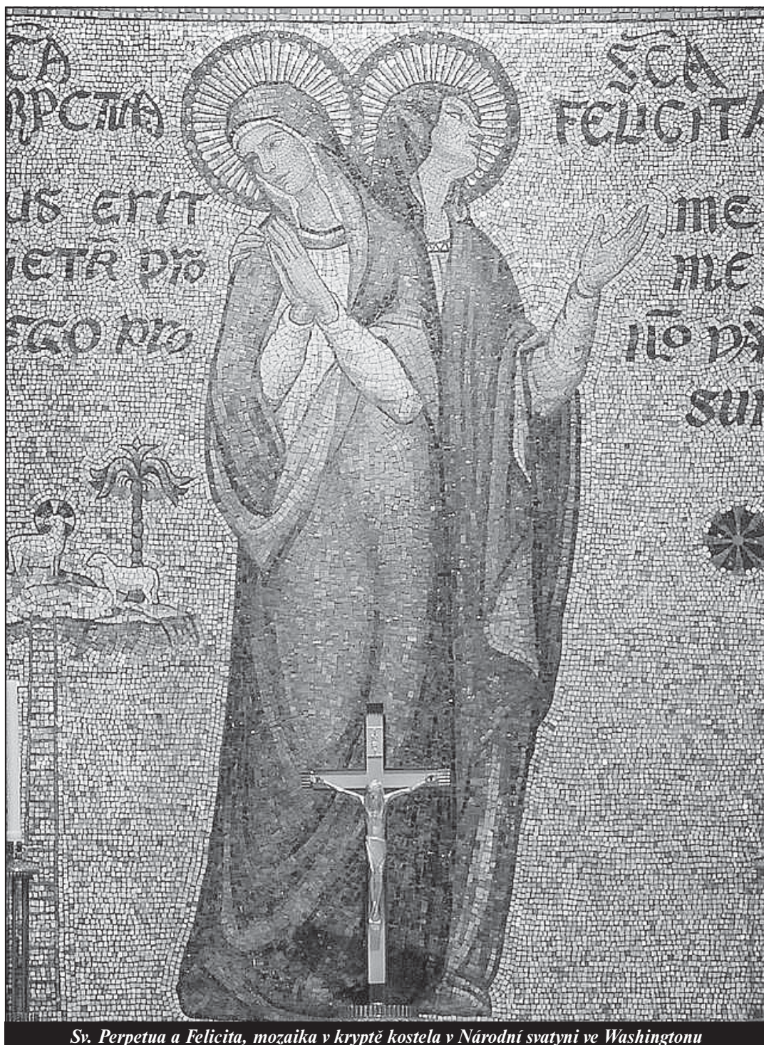
Sv. Perpetua a Felicitá, mozaika v kryptě kostela v Národní svatyni ve Washingtonu