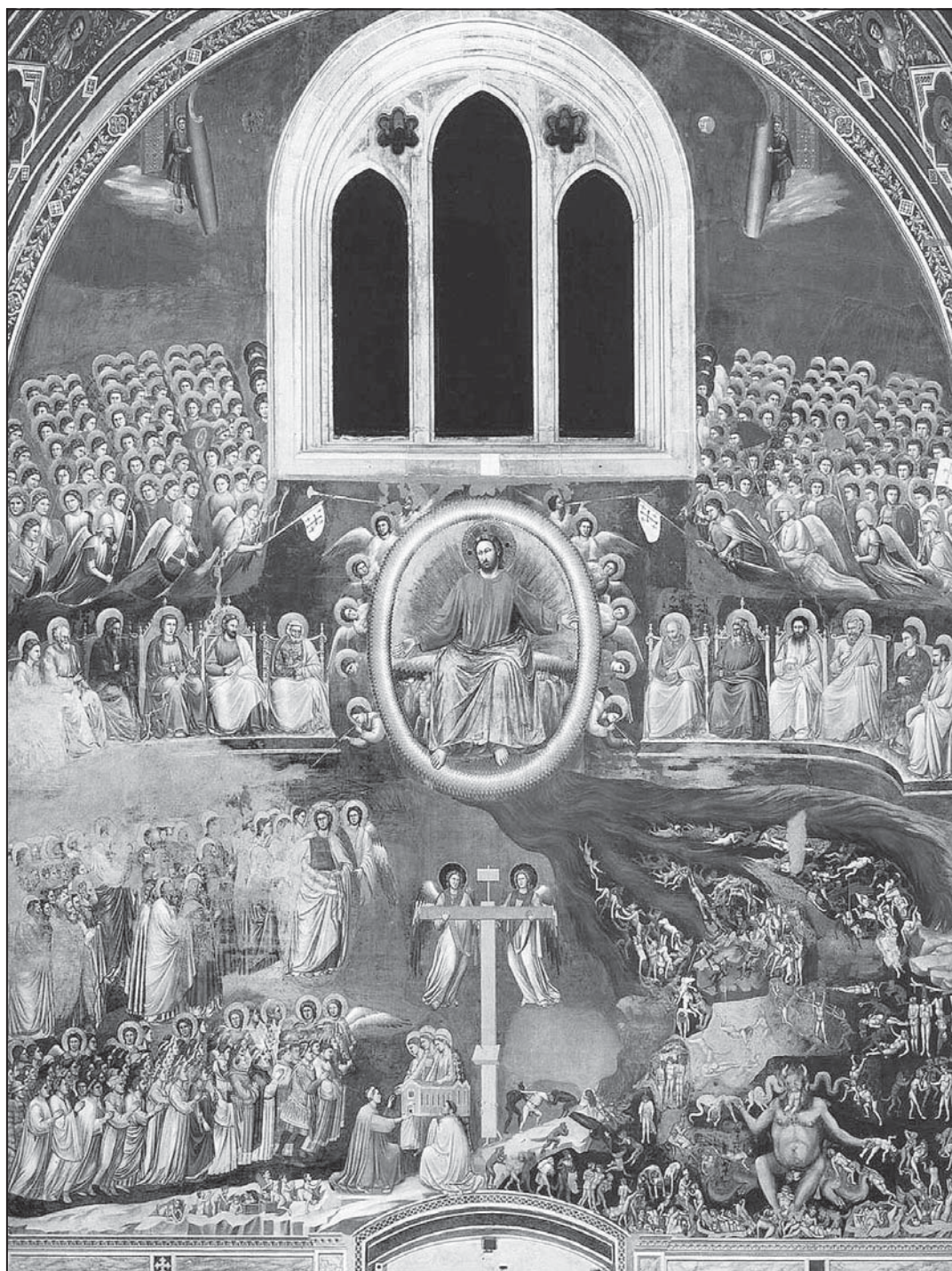
Giotto di Bondone (kolem 1267-1337): Poslední soud. Capella Scrovegni, Padova (Itálie)