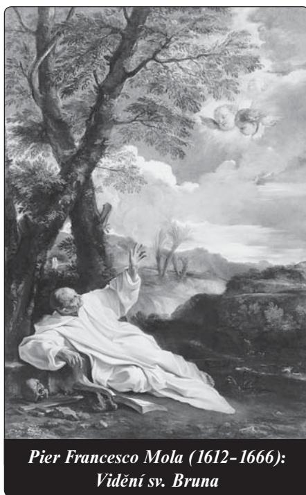
Pier Francesco Mola (1612–1666): Vidění sv. Bruna

„Milý Spasiteli, buď tak dobrý, a nechej svoji drahou krev téci do očistce, kde ubohé duše konají pokání. Ony trpí hořkou bolest, buď jim milostivý!“