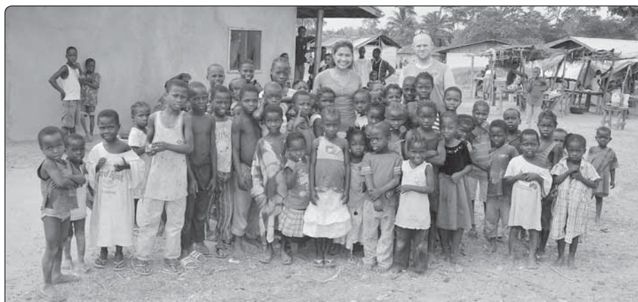
Návštěva vesnice Zon-Toa v Libérii při aktivním vyhledávání pacientů