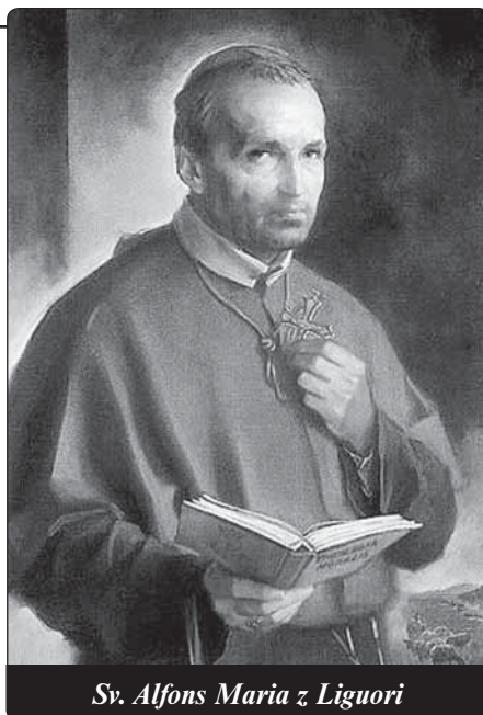
Sv. Alfons Maria z Liguori

Kdo chce být opravdu blažený, musí učinit pevné rozhodnutí a stále je obnovovat, že se nechce nikdy oddělit od Boha, a ať proto opakuje opravdu často výrok svatých: „Ať ztratím všechno, jenom ne Boha.“ Nestačí jenom pouhé předsevzetí, že Ho nechceš nikdy ztratit, musíš také používat prostředky, aby ses této ztrátě jistě vyhnul. Prvním prostředkem je útek před příležitostmi. O tom už byla řeč. Druhým je časté přijímání svatých svátostí, zpovědi a svatého přijímání. V domě, kde se často zametá, nevládne nečistota. Zpovědí se duše očistí a dostane se jí nejenom odpuštění hříchů, ale také pomoc k odporu proti pokušením. Přijímání ale je doopravdy nebeský chléb. A stejně jako tělo nemůže žít bez pozemského pokrmu, právě tak nemůže žít duše bez této nebes-