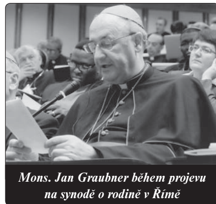
Mons. Jan Graubner během projevu na synodě o rodině v Římě

Nemůžeme například jen pracovat pro rodiny, ale musíme je zapojovat, nechat je