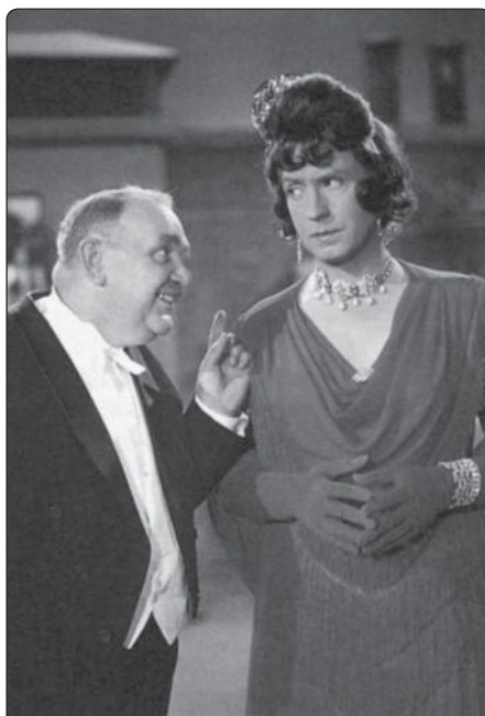
Peter Alexander v ženských šatech v Charleyově tetě. Co dříve bylo směšné, je dnes ideologickým nástrojem.

Odchov dětí se stane stále více mechanickou věcí podle vykonstruovaného schématu X a ztratí svůj přirozený a lidský rozměr výchovy. Stát a demokraticky