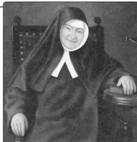
Bl. Matka Marie Terezie Bonzelová OSF (1830–1905)