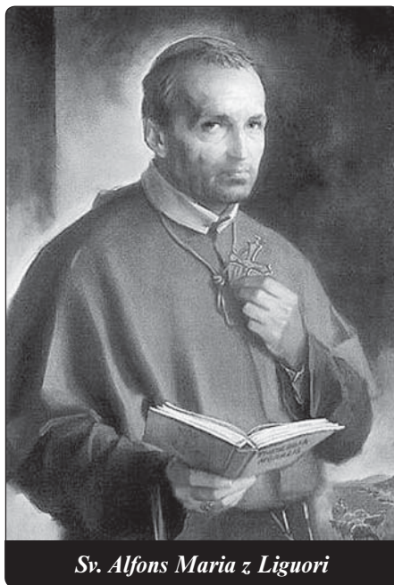
Sv. Alfons Maria z Liguori

Chtělo by se říci, nestěžujte si na mě, když nejste docela šťastní. Stěžujte si daleko více na sebe, že jste nedostali milostí ode mne. Proste mě proto ode dneška,