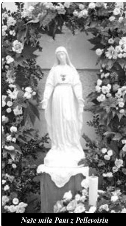
Naše milá Paní z Pellevoisin

„Ó moje dobrá Matko, kladu se Ti k nohám. Ty se nebudeš zdráhat mě vyslechnout. Ty jsi nezapomněla, že jsem Tvoje dcera a že Tě miluji. Proto mi dej od svého božského Syna k jeho větší slávě zdraví mého těla. Pohled na bolest mých rodičů. Ty víš velmi dobře, že nemají nikoho, kdo by je podporoval. Nesmím dílo, které jsem započala, dovést do konce? Jestliže mi pro