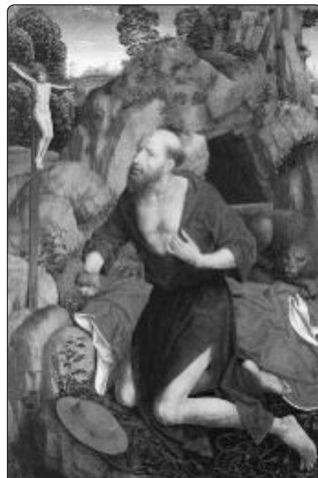
Hans Memling (kolem 1433-1494): Sv. Jeroným

Tělo odříkavostí a duševními pracemi tak zesláblo, že se nemohl ani na loži ob-