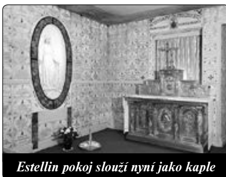
Estellin pokoj slouží nyní jako kaple

Slyš milostivě moji úpěnlivou prosbu, moje dobrá Matko, a předej ji svému božskému Synu. Když to bude jeho vůle, ať mi znovu daruje zdraví, ale ať se stane jeho a ne