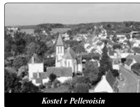
Kostel v Pellevoisin