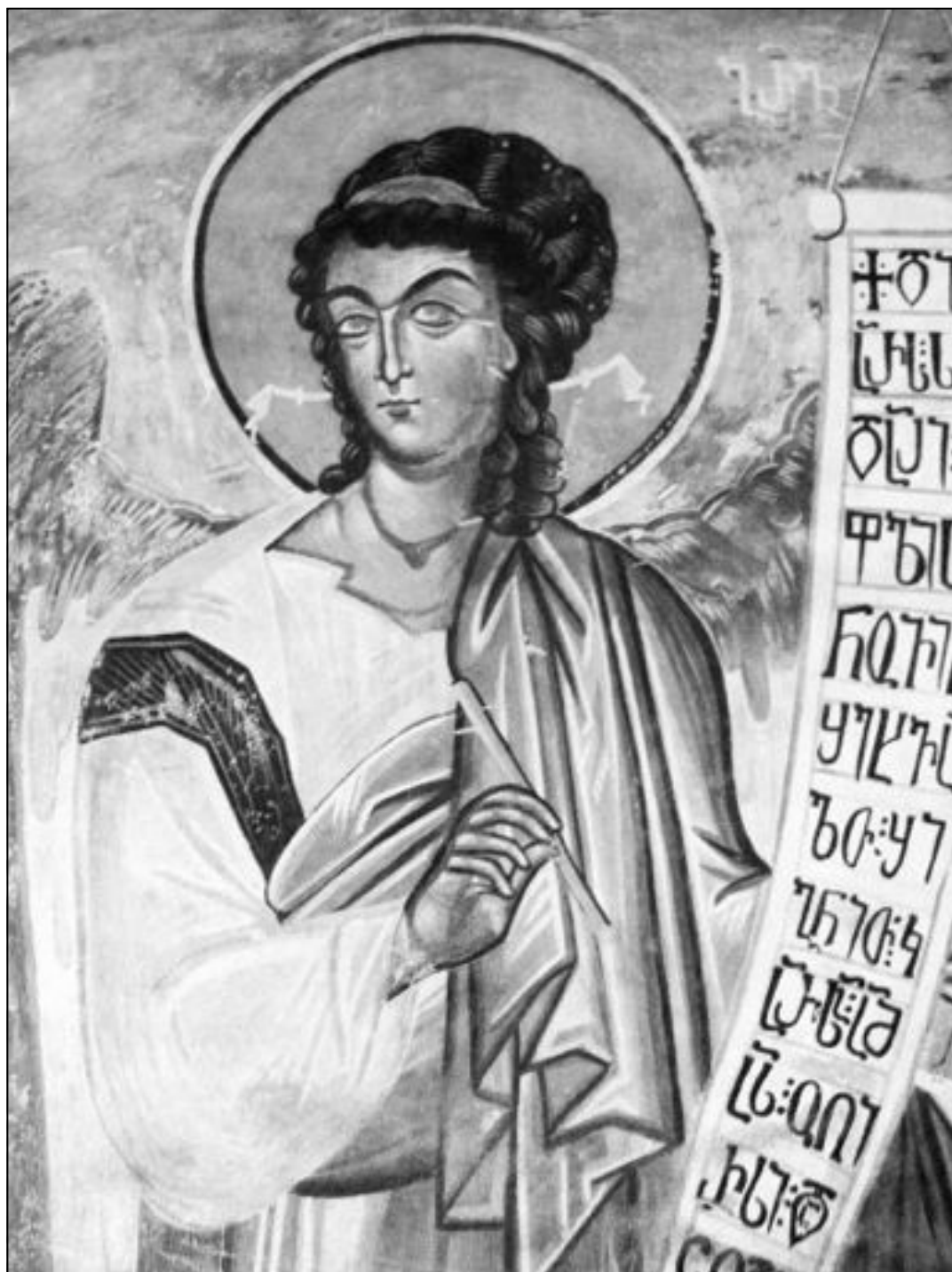
Archanděl Gabriel, katedrála gruzínské pravoslavné církve, Calendžicha, 14. století

Rodina v katolickém pojetí - strana 13 -