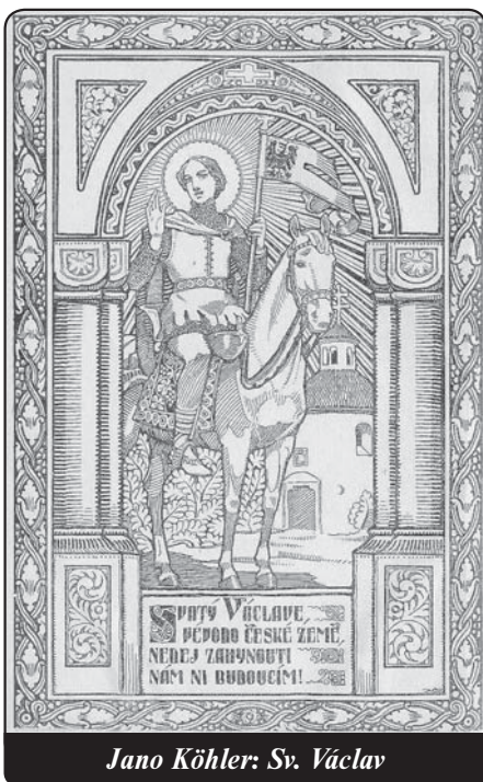
Jano Köhler: Sv. Václav

snaží přiblížit podle svých možností a sil, přičemž pracuje na tom, aby křesťanské národy tvořily společenství ve vzájemné úctě, respektu a bratrství. Tento křesťanský univerzalizmus, jenž zachovává přirozené hodnoty zbožnosti a zdravého vlastenectví, nemá nic společného s levicovým internacionalismem nebo liberálním kosmopolitismem, jež potlačují identitu národů, vysmívají se jí, rozkládají ji.