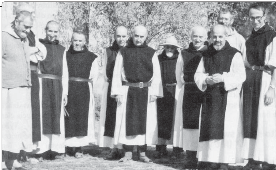
Mniši trapistického kláštera v Tibhirine

Jediná síla, která brání před zlem a jeho rozhodováním zabíjet, je dar . Vstoupit do Kristovy logiky: „Je-li možno, pokud to záleží na vás, žijte se všemi v pokoji. Nechtějte sami odplácet, milovaní, ale nechejte místo pro Boží soud. (...) Jestliže má tvůj nepřítel hlad, nasýť ho,