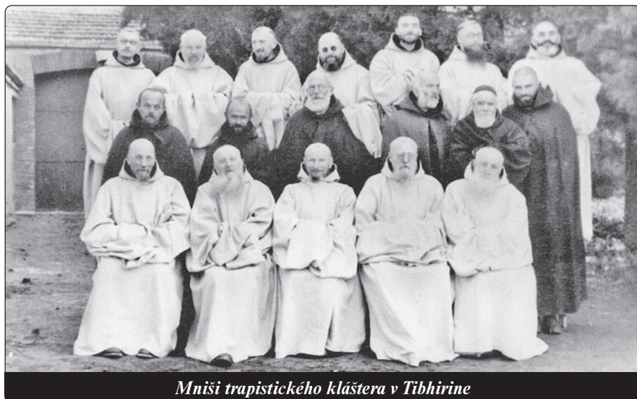
Mniši trapistického kláštera v Tibhirine