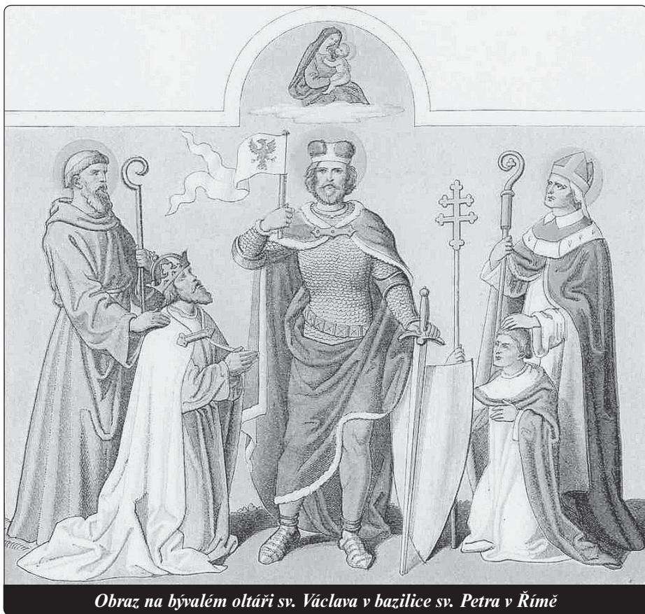
Obraz na bývalém oltáři sv. Václava v bazilice sv. Petra v Římě

Zřídka se v cizině setkáváme s místními názvy nesoucími světcovo jméno. Takovou obcí je slovinská farnost Sveti Venčesl