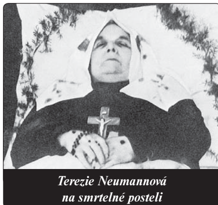
Terezie Neumannová na smrtelné posteli

Jako jiní mystikové (mezi nimi P. Pio) měla dar bilokace: bylo jí možno vidět současně na dvou různých místech. Jednoho dne si jeden zoufalý muž chtěl vzít život. Najednou se před ním objevila Terezie (která neopustila svůj pokoj) a odvrátila ho od jeho úmyslu. Jindy kněz, jenž vedl život, který by se nedal označit za chvályhodný, v okamžiku přijímání viděl před sebou Terezii s jejími stigmaty, jak pláče. Rozhodl se změnit svůj život a jeho obrácení bylo trvalé.