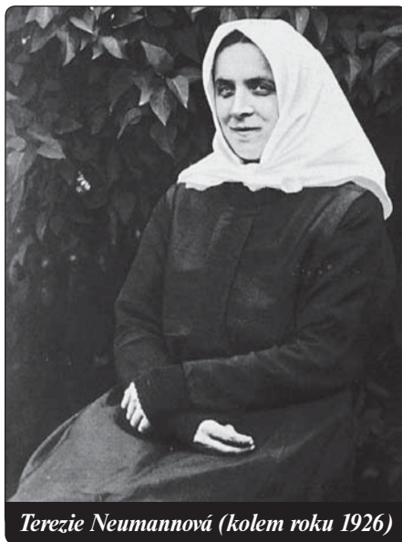
Terezie Neumannová (kolem roku 1926)

Terezie přijímala bezpodmínečně Boží vůli („vše bude pro mne dobré, tak jak se Bohu líbí“). O několik měsíců později dostala Terezie postupně stigmata. V únoru 1926 byla postižena nevolností, která ji přinutila zůstat až do Velikonoc na lůžku. V noci ze čtvrtka 4. března na pátek 5. března měla náhle vizi Ježíše, který klečí v Getsemanech. Slyší, jak se modlí, a vidí, jak apoštolové spí. Když na ni Vykupitel s láskou pohleděl, ucítila v krajině srdeční tak silnou bolest, že uvěřila, že zemře. Když byla opět při smyslech, uviděla, že část jejího těla byla zaplavena krví a že na levé straně se otevřela rána, která krvácela až do příštího dne. O týden později viděla opět ve stejnou hodinu Ježíše v Olivové zahradě. Tentokrát však byla přítomna i bičování. V následujícím týdnu viděla také ještě korunování trním a pokaždé silně krvácela rána na jejím srdci. V pátek pašijového týdne byla u toho, když Ježíš nesl kříž, a na její levé ruce se utvořila rána. Následující týden byla svědkyní celého utrpení a nyní se vytvořily rány na její pravé ruce a na nohou. Tentokrát rodiče zavolali faráře, který ve svém deníku píše: „Naříkala jako mučednice. Její oči byly podlité krví, dva potůčky krve stékaly po jejich lících. Byla bledá jako umírající. Až do 15. hodiny, smrtelné hodiny Kristovy, trpěla hrozným smrtelným strachem, po-