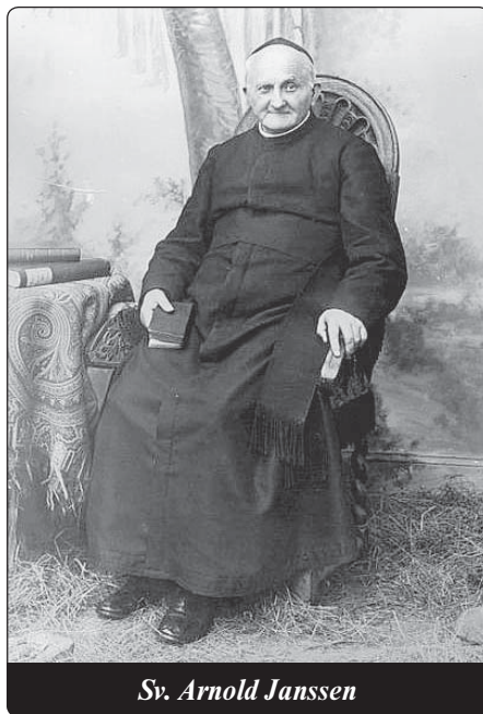
Sv. Arnold Janssen

V prvních desetiletích 19. století vzbuzovala v celém münsterském kraji velkou úctu stigmatizovaná žena, Anna Kateřina Emmerichová (blahořečena 3. října 2004). I když zemřela roku 1824, zůstala mezi lidem živá až do našich dnů. Její vize (sepsané Clemensem Brentanem) se pilně četly, také Arnold Janssen jí byl fascinován, použil její vize k předcítání v Bocholtu a potom ve Steylu. V časopisu vzniklém v roce 1874 „Malý posel Srdce Ježíšova“ šířil její poselství. Byla pro něho „skoro nepř-