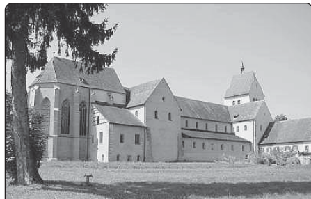
Romantický klášter sv. Marie a Marka na ostrově Reichenau, který patří od roku 2000 ke světovému kulturnímu dědictví. Dřívější klášterní kostel je dnes farním kostelem.

I když někteří učenci po určitou dobu zpochybňovali její původ, dnešní doba mu zase autorství tohoto mariánského velebení připisuje. Bylo zapotřebí ticha a odloučenosti ostrovní zahrady, aby mohla vykvést taková vroucí mariánská modlitba.