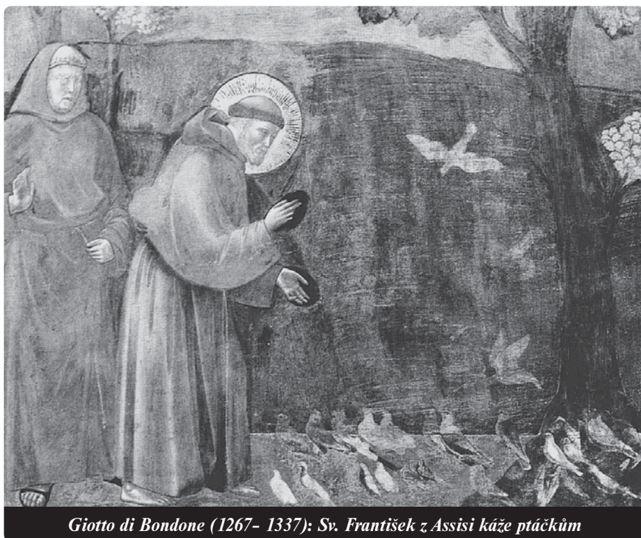
Giotto di Bondone (1267- 1337): Sv. František z Assisi káže ptáčkům

Není divu, že se útok ďábla zaměřil nejprve na vztah s Bohem! Tím, že lidi svedl ke hříchu, zničil nejprve jejich lásku k Bohu, současně s tím vztah mezi mužem a ženou (Gn 3,16) a v následnosti také vztah ke zvířatům, který je dodnes často určován vzájemným strachem (Gn 9,2).