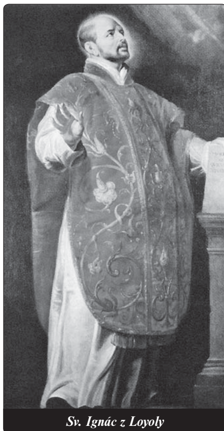
Sv. Ignác z Loyoly

Stovky milionů lidí, kteří na celém světě běžně využívají gregoriánský kalendář, si zcela určitě vůbec neuvědomují, že používají něco, co bylo zpočátku v mnoha koutech Evropy (zvláště protestanské) vnímáno jako další projev „jezuitských machinací“. Když roku 1582 zavedl papež Řehoř XIII. nový kalendář (gregoriánský)