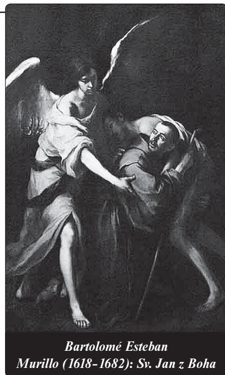
Bartolomé Esteban Murillo (1618–1682): Sv. Jan z Boha

Po jednom válečném tažení se dal do služby k vyhnanému šlechtici a staral se o rodinu, která upadla do chudoby. Milosrdenství otevřelo jeho srdce. Četl evangelium a náboženské knihy a provozoval pak v Granadě obchod s knihami až do roku 1539, kdy přišel do Avily slavný kazatel Jan z Avily. Jeho poselství Jana zasáhlo: „Hřích je nejnebezpečnější utrpení.“ On poznal svoje hříchy. Uprostřed posluchačů začal křičet: „Milosrdenství, můj Bože, milosrdenství!“ Vrhle se na podlahu, bil hlavou do zdi, trhal si vous a rozdal všechno, co měl. Posmívali se mu jako „šilenému“ a dali ho do špitálu pro duševně nemocné. Bez odmítání při-