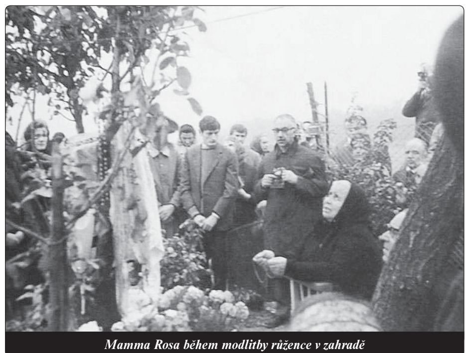
Mamma Rosa během modlitby růžence v zahradě