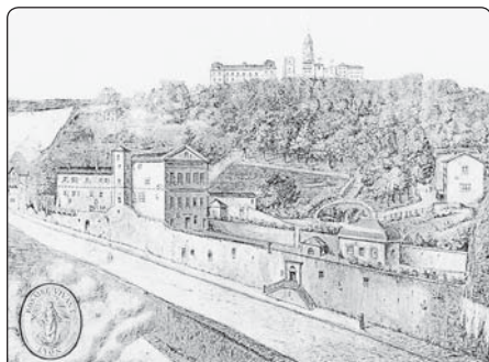
Dům Loreta v Lyonu – dobová kresba, místo setkání několika pozdějších světců, mezi nimiž zvláště vynikají sv. Jan Maria Vianney a Petr Julián Eymard

Ani nouze dělníků v Lyonu neponechávala Pauline chladnou. „Zdá se mi, že se dělníkům musí nejprve vrátit lidská důstojnost, aby byli osvobozeni od nedůstojného otroctví špatně placené činnosti. Potom jejich důstojnost otce v kruhu rodiny a v dobrém, zdravém bytí. A také křesťanská důstojnost útěchou a nadějí náboženství. Bůh sám vás zavazuje k sociální spravedlnosti,“ říká a zasazu-