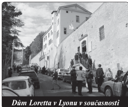
Dům Loreta v Lyonu v současnosti