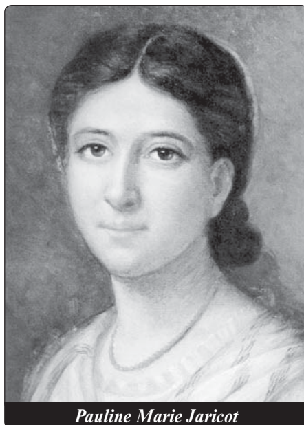
Pauline Marie Jaricot

Pauline se rozhodla radikálně změnit svůj život teprve na základě ohlasu, který ve městě vyvolalo kázání abbého Würtze „o iluzích marnivosti“ při jedné večerní pobožnosti v kostele St. Nizier. Začala se oblékat do šatů dělnic, prodala své šperky, hedvábné látky svých plesových šatů nechala přeseít na kněžská bohoslužebná roucha. Vnější změny odpovídaly radikálnímu vnitřnímu obrácení: Místo toho, aby se účastnila společenských zábav, navštěvovala nevléčitelně nemocné ve špitálech a pečovala o ně. V kapli ve Fourvière složila o Vánocích 1816