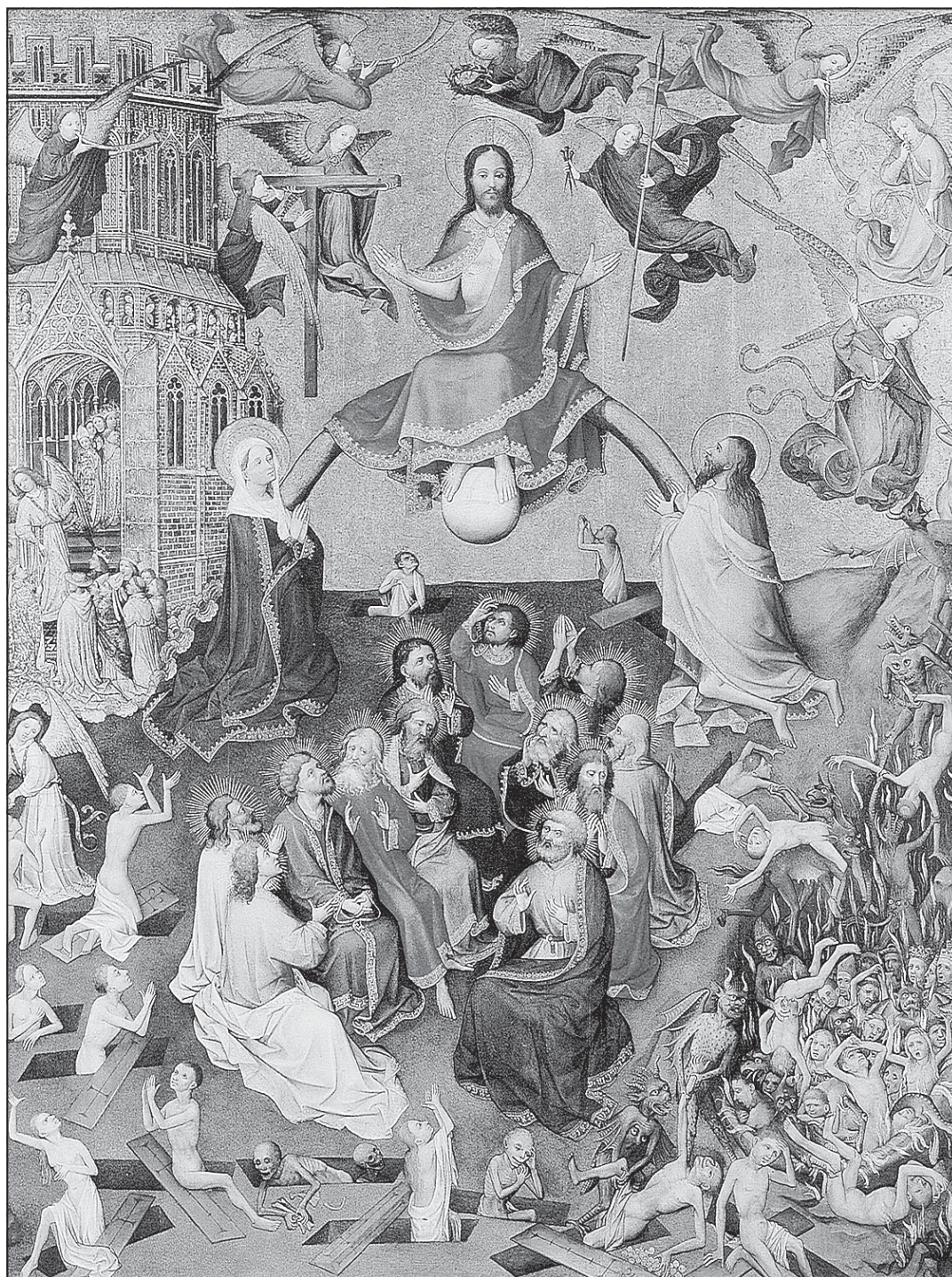
Stefan Lochner (kolem 1410–1451): Poslední soud, výřez (olejomalba na plátně)