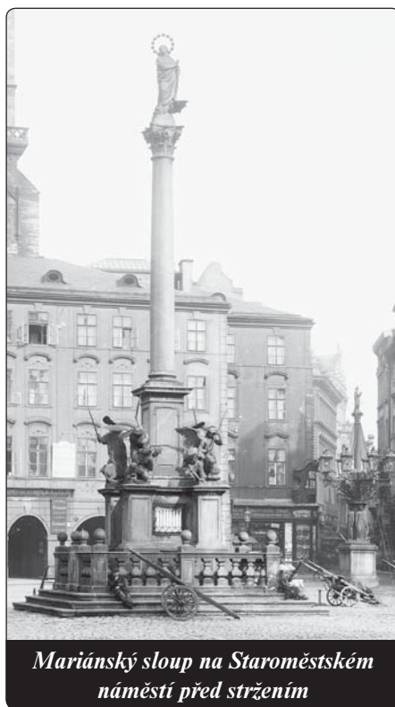
Mariánský sloup na Staroměstském náměstí před stržením

České katolické intelektuální prostředí a náš politický katolicismus, stejně