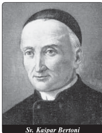
Sv. Kašpar Bertoni

Tím předběhl dobu v tom, co se později rozvinulo jako hnutí Katolické akce. „Mariánská kohorta“ byla totiž rozdělena na skupiny seniory, mládež, žáci, děti, podobně jak je tomu