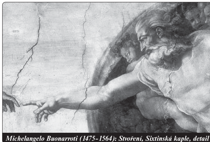
Michelangelo Buonarroti (1475–1564): Stvoření, Sixtinská kaple, detail

2. Křesťanská víra se vztahuje na takové věci, které si nemůžeme smysly ověřit nebo rozumem pochopit.