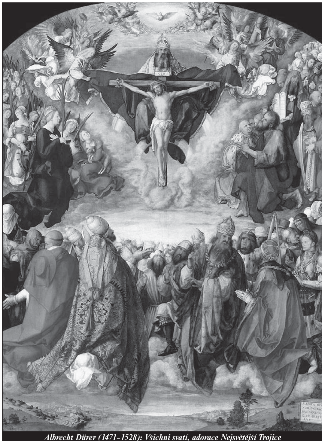
Albrecht Dürer (1471-1528): Všichni svatí, adorace Nejsvětější Trojice