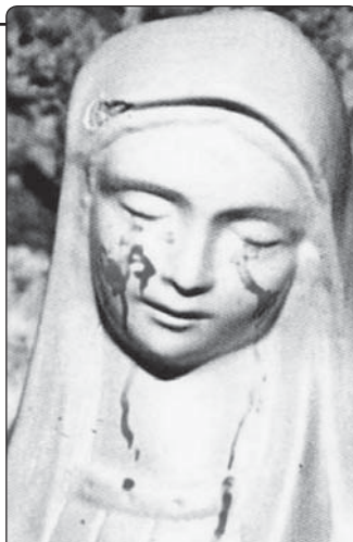
2. února 1995 začaly z očí sochy Panny Marie vytékat krvavé slzy