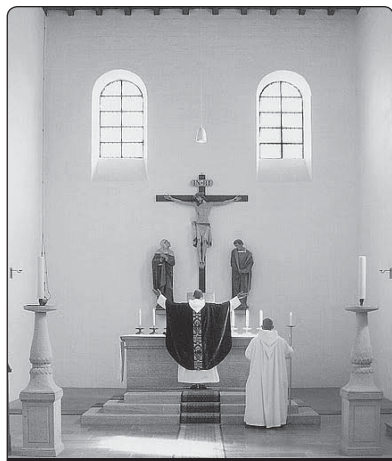
Kartuziánský mnich při Nejsvětější oběti

Bruno v roce 1091 a žil v něm až do své smrti 1101. Dnes zde žije 15 mnichů podle nej přísnější mnišské řehole. Mnichům řekl papež, že nestačí se pro takový život rozhodnout, ale je třeba prožívat ho v každodenním řádu, trpělivosti a cvičení a vytvářet prostor, aby mohl působit Bůh a rostlo naše vědomí, že jsme bratři v Kristu.