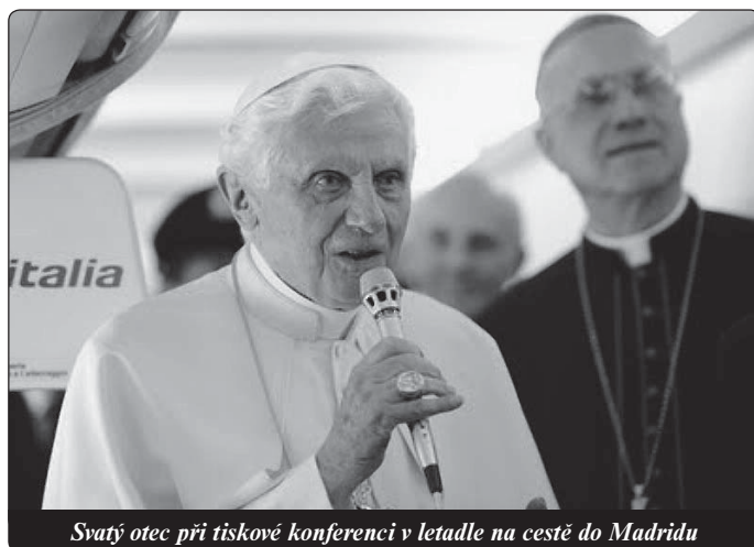
Svatý otec při tiskové konferenci v letadle na cestě do Madridu

ří trpí, mají žízeň a hlad, nemají budoucnost. A pak třetí dimenze této odpovědnosti je odpovědnost za budoucnost. Víme, že musíme chránit svou planetu, ale musíme také vzít v úvahu, aby služba ekonomické činnosti fungovala pro všechny, a myslet na to, že budoucnost je také dnešek. Jestliže dnes mladí nenacházejí perspektivu pro svou budoucnost, je náš dnešek pochýbený a je „špatný“. Proto církev svou sociální naukou, svou naukou o odpovědnosti před Bohem otevírá kapacitu zřítí se maximálního užítku a vidět věci v rozměrech humanistických a náboženských, tzn. být