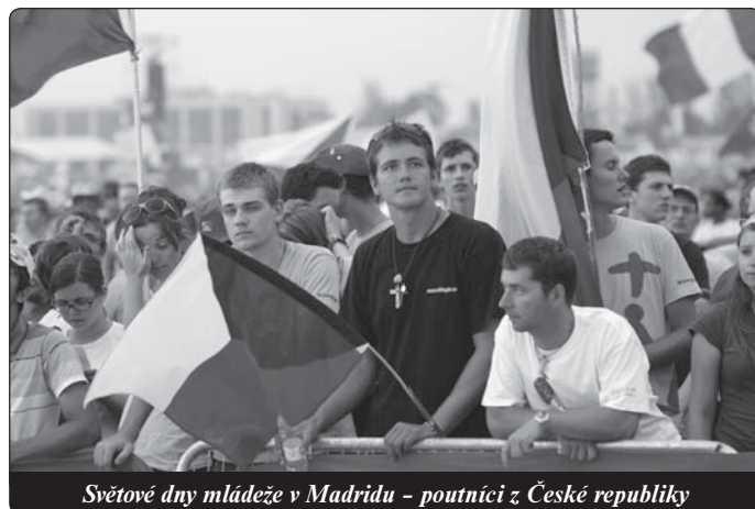
Světové dny mládeže v Madridu - poutníci z České republiky