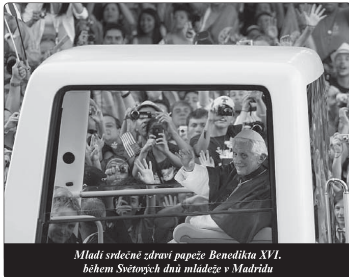
Mladí srdečně zdraví papeže Benedikta XVI. během Světových dnů mládeže v Madridu