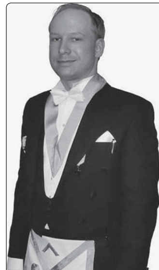
Anders Breivik v zednářském úboru

Vedle těchto údajů je relativně podružné, zda se u Breivika jedná o duševní poruchu, šílenství nebo rozpad osobnosti.