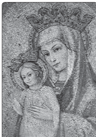
Mozaika Mater Ecclesiae

Papež dodal, že je třeba najít vhodné řešení zasazené do náměstí bohatého na velmi majestátní a sugestivní umění. Byl jsem pověřen, abych navázal kontakt s biskupem Giovannim Fallanim, který byl předsedou komise pro ochranu historických památek Svatého stolce, a Carlem Pietrangelim, ředitelem vatikánských muzeí. Pietrangeli byl nejdříve skeptický. Mons. Fallani sdělil, že před několika měsíci dostal návrh umístit mariánskou mozaiku do jed-