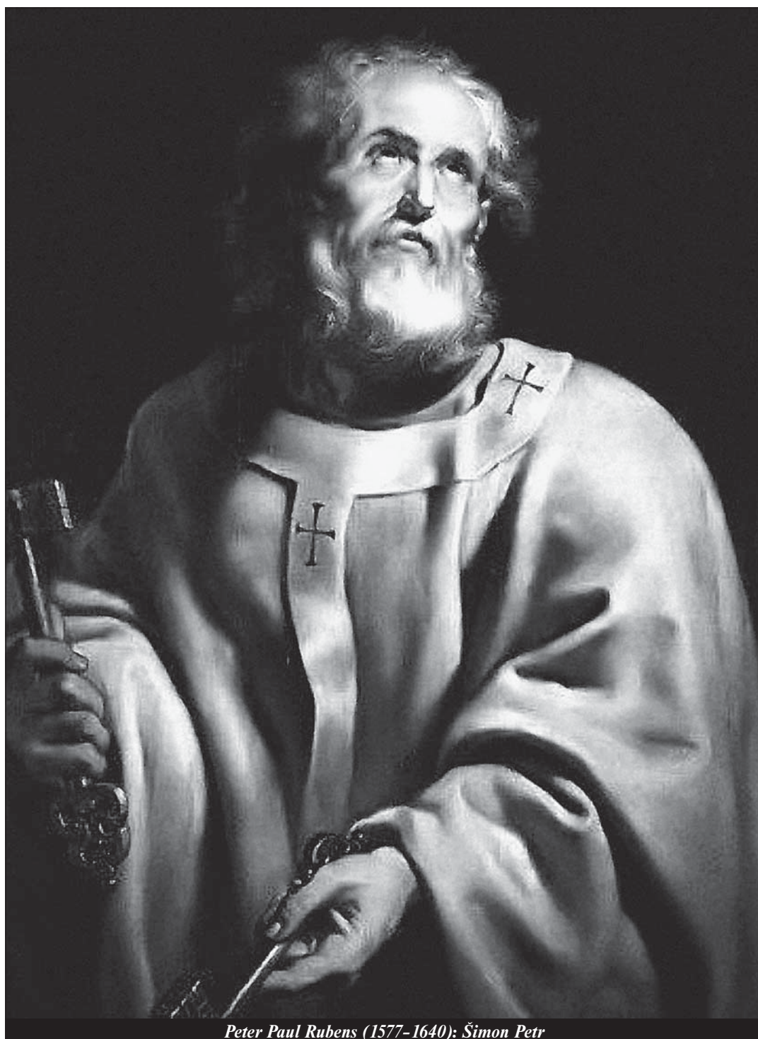
Peter Paul Rubens (1577-1640): Šimon Petr