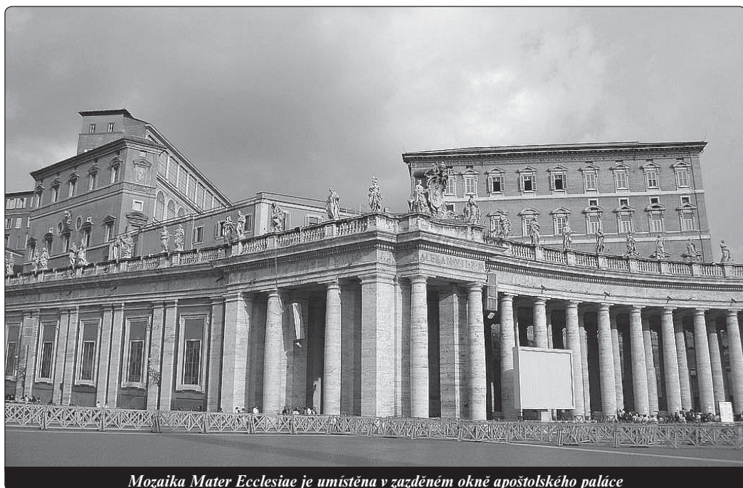
Mozaika Mater Ecclesiae je umístěna v zazděném okně apoštolského paláce

L'Osservatore Romano 1. července 2011 Překlad -lš