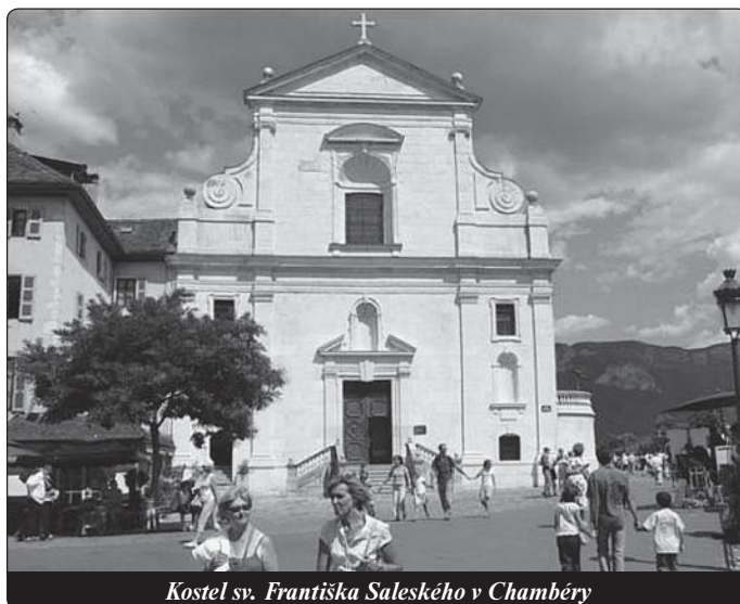
Kostel sv. Františka Saleského v Chambéry