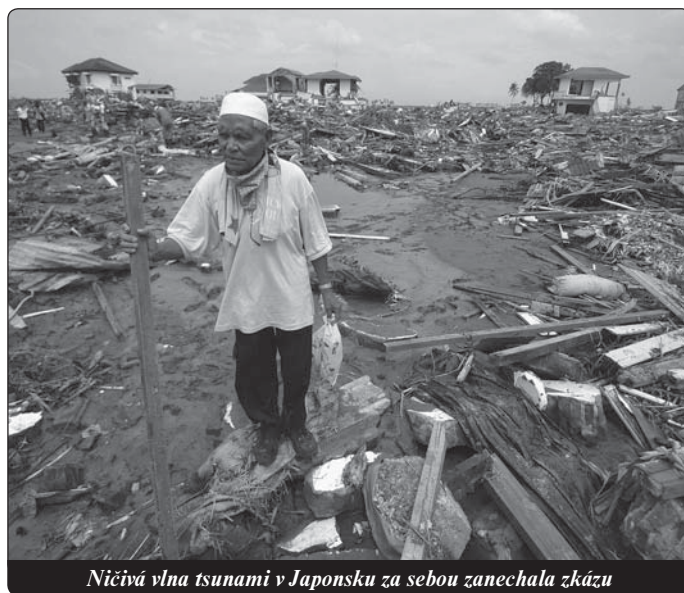
Ničivá vlna tsunami v Japonsku za sebou zanechala zkázu

Že Bůh se svobodně zdržuje zasahovat, když člověk používá své svobody, je jisté. Ale znamená to současně, že bychom mohli prostě říct, že se Bohu vymkla z rukou jeho všemohoucnost? To by znamenalo, že svět je ponechán zcela sám sobě a funguje zcela nezávisle na Bohu. Zajímavé! V takovém případě by Bůh nebyl ničím vinen. Pak ovšem není ničím jiným než ideálním obrazem lásky a spravedlnosti, aniž by byl ve světě přítomen. A i když si to umíme představit, nebylo by to pro něho omluvou. Byl by něco jako čarodějův učeň neschopný ovládnout své dílo. ▶