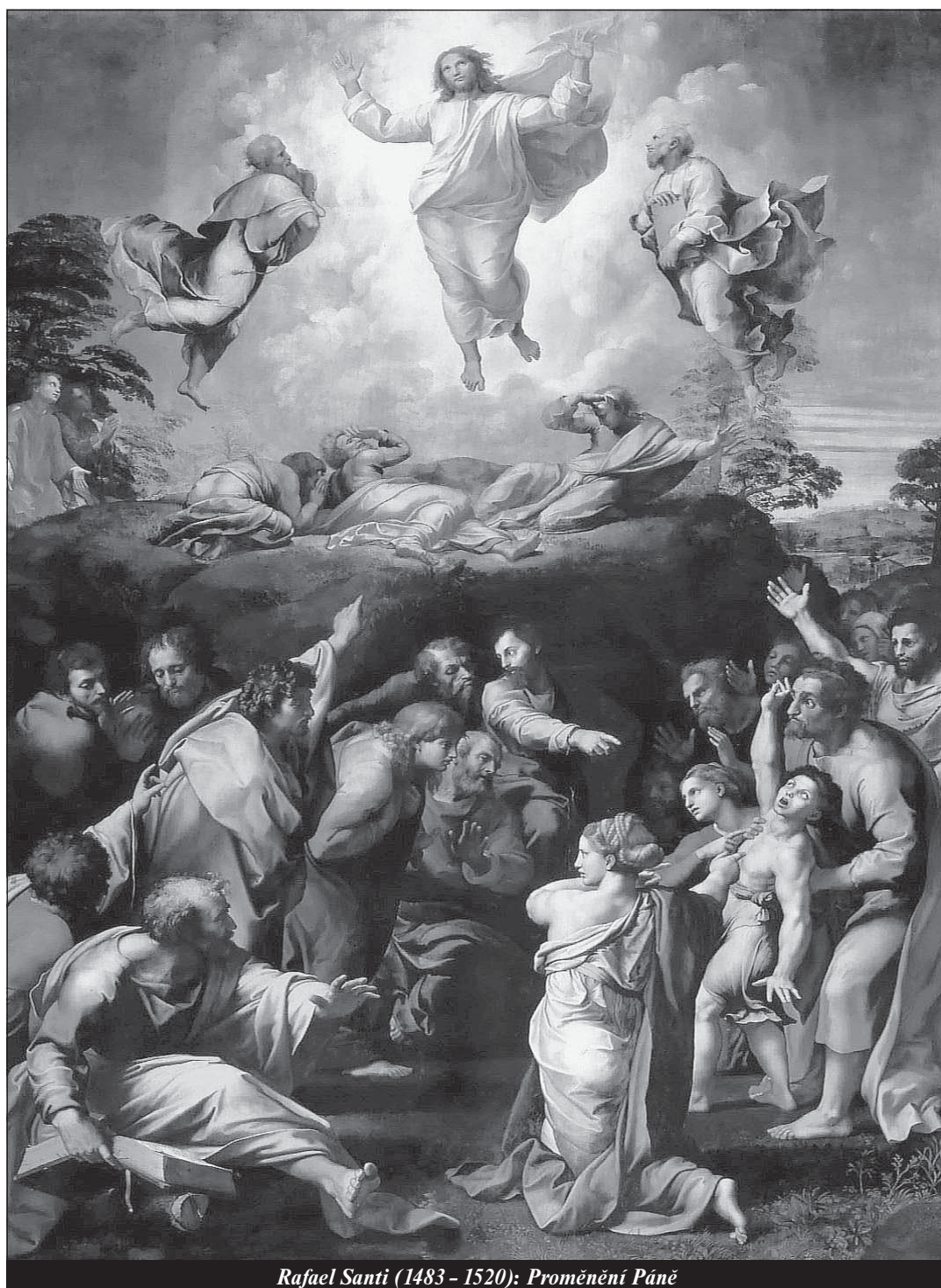
Rafael Santi (1483 - 1520): Proměnění Páně