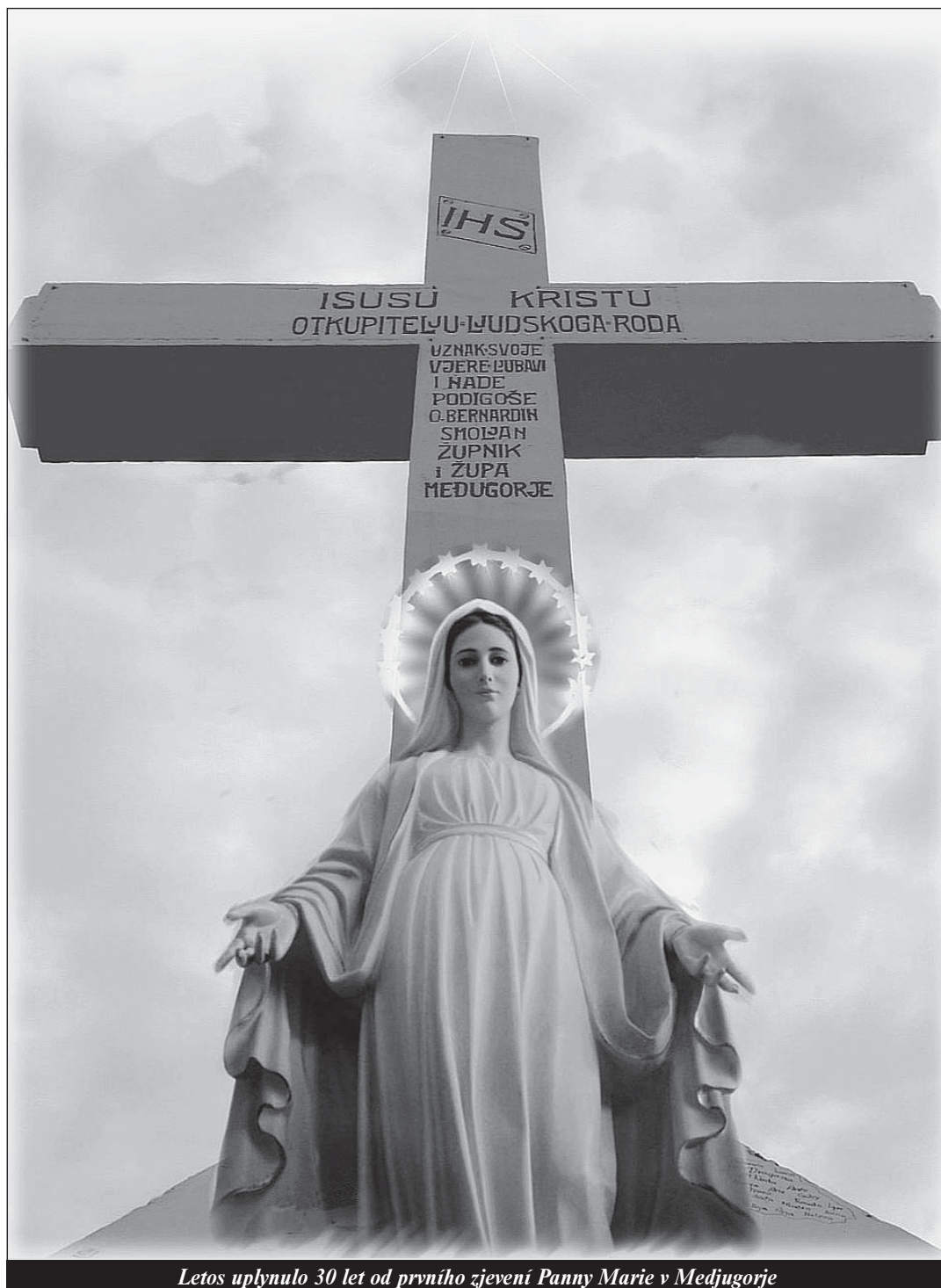
Letos uplynulo 30 let od prvního zjevení Panny Marie v Medjugorje

Služba pravdě a spravedlnosti - strana 11 -