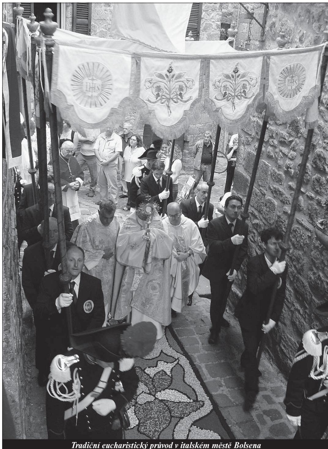
Tradiční eucharistický průvod v italském městě Bolsena

Mše svatá - zdroj svatosti Mateo Crawley - strana 11 -