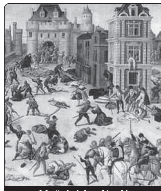
Mučedníci ve Vendée

„Vendée už neexistuje. Pohřbil jsem ho v bažinách Savenay. Děti jsem dal rozdupat koňskými kopyty a ženy zmasakrovat. Ani jednoho zajatce si nemůžu vyčítat. Všechny jsem vyhladil...“