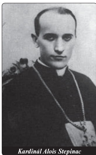
Kardinál Alois Stepinac

čedníka. Ten se ve jménu Krista postavil s odvahou nejdříve proti útisku nacismu a fašismu a pak proti represím komunistického režimu. Byl uvězněn a internován v rodné vsi. Poté, co ho papež Pius XII. jmenoval kardinálem, zemřel r. 1960 na následky nemoci, ke které přišel ve vězení. Ve světle jeho svědectví jsem povzbudil biskupy a kněze v jejich službě a vyzval je k apoštolskému úsilí. Osobám zasvě-