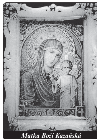
Matka Boží Kazaňská