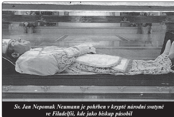
Sv. Jan Nepomuk Neumann je pohřben v kryptě národní svatyně ve Filadelfii, kde jako biskup působil

sto. Inicioval stavbu 80 kostelů, k tomu jedné katedrály a prvního kostela pro italské katolíky v USA. Jsou to živá místa křesťanského života a kamenní svěd-