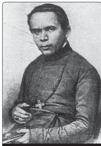
Sv. Jan Nepomuk Neumann

je dodnes ve Státech nejvýznamnější. V době biskupa Neumanna měla 300 000 katolíků. Když přišel, byly zde dvě farní školy. Když zemřel, bylo jich více než