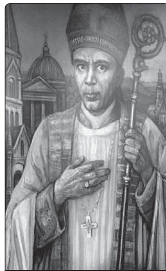
Sv. Jan Nepomuk Neumann