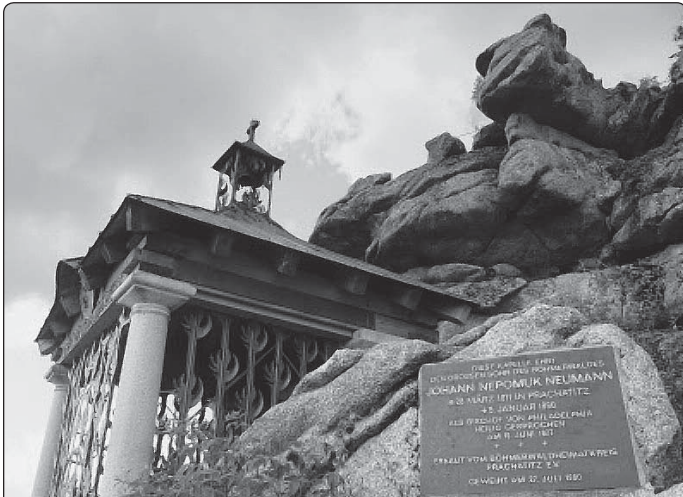
Pohled na malebnou kapli u Trístoličnicku na Šumavě, která je zasvěcena prachatickému rodákovi sv. Janu Nepomuku Neumannovi

Překlad -lš-