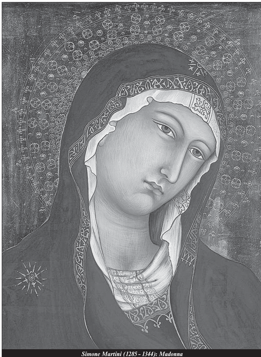
Simone Martini (1285 - 1344): Madonna

Svatý František obrací heretiky (15) - strana 11 -