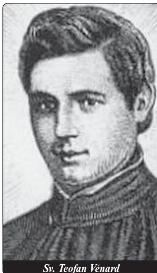
Sv. Teofan Vénard