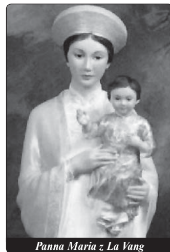
Panna Maria z La Vang

le s doškovou střechou. Pověst o tomto místě se rozšířila po celé zemi. I přes obtížný přístup sem putovalo velké množství lidí.