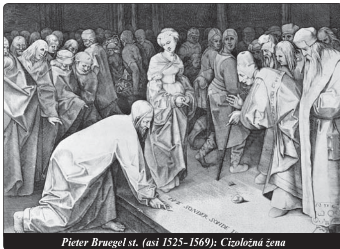
Pieter Bruegel st. (asi 1525–1569): Cizoložná žena

Taková „zapomenutá neodpuštění“ dřímou v podvědomí. A neuvědomované neodpuštění je hořkým kořenem pro mnoho negativního. Negativními plody „hořkých kořenů“ jsou např. negativní očekávání, precitlivělost, agrese, hněv, zlost, tvrdost, chlad, „kamenné srdce“. Lidé,