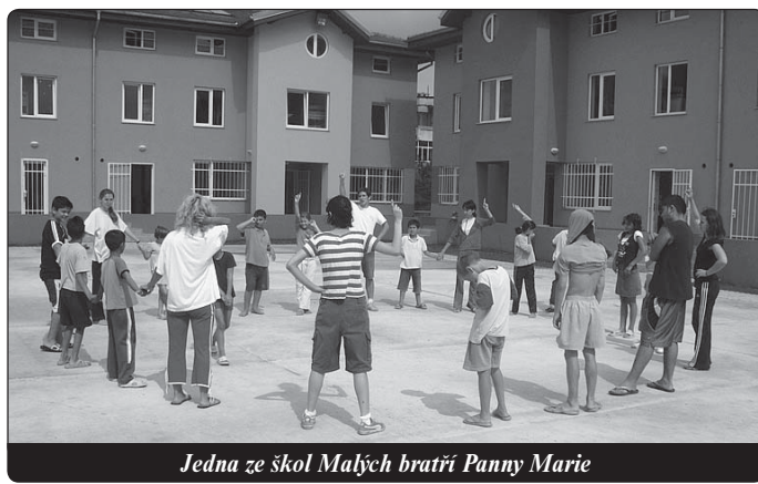
Jedna ze škol Malých bratří Panny Marie