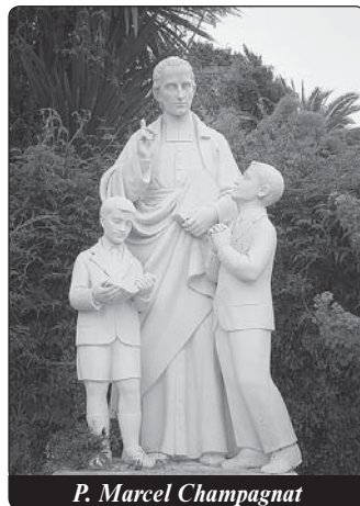
P. Marcel Champagnat

podají se mi to.“ Na podzim 1805 odejde do malého semináře ve Varricres. Tam se ze všech sil věnuje studiu. Má šestnáct let, jeho spolužáci jsou mladší než on a vysmívají se mu. Počátky jsou obtížné a učitelé příliš nepovzbuzují. Nicméně ani jeho