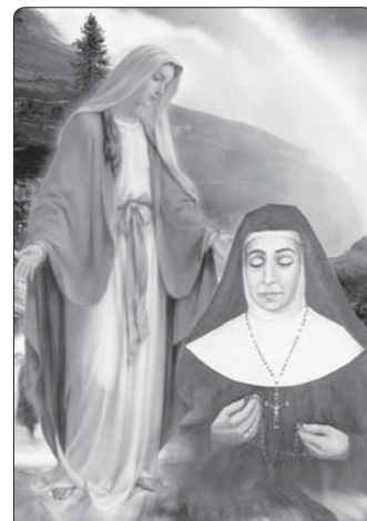
Sestra Maria Alfonsina Ghattas

Nová blahoslavená se narodila v Jeruzalémě v zámožné palestinské rodině. Ve 14 letech vstoupila do řádu sv. Josefa. Obdržela ve vidění pokyn k založení společnosti mladých arabských žen se jménem Růžencové sestry. Kongregace vznikla v roce 1880. Dnes má kongregace 260 sester, které pečují o vzdě-