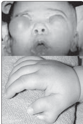
Genetické mutace po havárii atomové elektrárny v Černobylu

Přirozený výběr působí pouze u individuí deformovaných, slabých, nepřízpusobených podmínkám daného druhu tak, že vede k jejich zániku. Nemůže však vytvářet nové druhy, nové genetické informace ani nové orgány.