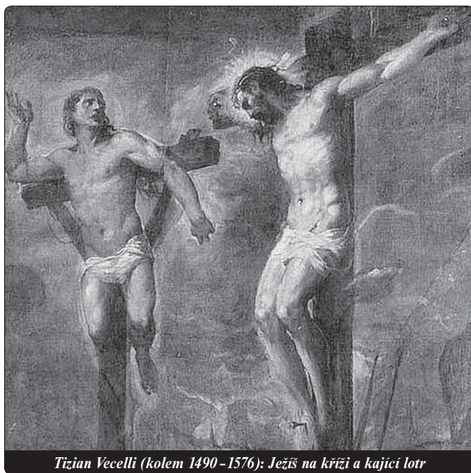
Tizian Vecelli (kolem 1490–1576): Ježíš na kříži a kající lotr

Odpuštění je práce, stojí námahu, někdy také slzy. Nezapomínejte začít krátkou modlitbou: „Pane, pomoz mi odpustit! Přijď, Duchu Svatý, zahoj, co je zraněno!“