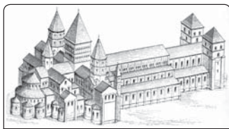
Historická kresba clunyského kláštera (délka chrámu 180 m)

mohly se rychle rozšířit ideály ryzosti a věrnosti, které se clunyská reforma snažila sledovat. Navíc, opati byli voleni bez jakýchkoliv zásahů ze strany civilní autority, zcela jinak než tomu bylo na jiných místech. Ve vedení Cluny a četných závislých mnišských komunit se střídaly osobnosti opravdu důstojné: opat Odon z Cluny, o kterém jsme hovořili v jedné katechezi před dvěma měsíci, dále Emard, Maiolo, Odilo a Hugo Veliký, kteří rozvíjeli své půso-