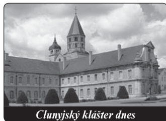
Clunyský klášter dnes

Clunyská reforma měla pozitivní dopad nejen na očistění a nové probuzení mnišského života, ale i na život celé všeobecné církve. Neboť tužba po evangelijní dokonalosti představovala podnět pro boj proti těžkým nešvarům, které sužovaly Církev v onom období: simonii, tj. nabytí pastoračních úřadů za od-