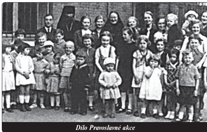
Dílo Pravoslavné akce

Nová cesta, objevená jako „kráčení po vodě“, je mnišství ve světě; mnich, který miluje Boha nade všechno. Nezříká se světa, ale obětuje ho Stvořiteli a stojí uprostřed samotného světa: není zde žádné odříkání, ale není zde ani splnutí se světem, redukování Církve na dobročinnou instituci: „Je třeba, aby se naše iniciativa stala dílem všech, kteří z ní mají prospěch, a nestala se dobročinnou akcí jako takovou, kde jedni prokazují dobro a ukazují přebytky a druzí přijímají dobročinnost, aby udělali místo dalším.“ Mimo oblast starých zakázů i nových revolučních snů se jedná o novou kreativní intuici, která člověka vrací, aby vytvořil mezi Bohem a světem nové pouto, které nikdo nemůže zlomit. Charitativní aktivita vede matku Marii k zakládání hospiců, sanatorií a konviktů, z nichž nejslavnějším je onen na ulici de Lourmel 77: „Je to neobvyklý blázinec: jsou zde dívky, bezdomovci, nezaměstnaní a nyní také dva sbory, jeden z ruské opery a jeden gregoriánský, misijní centrum a bohoslužby v kapli ráno a večer.“ To, co se mnohým