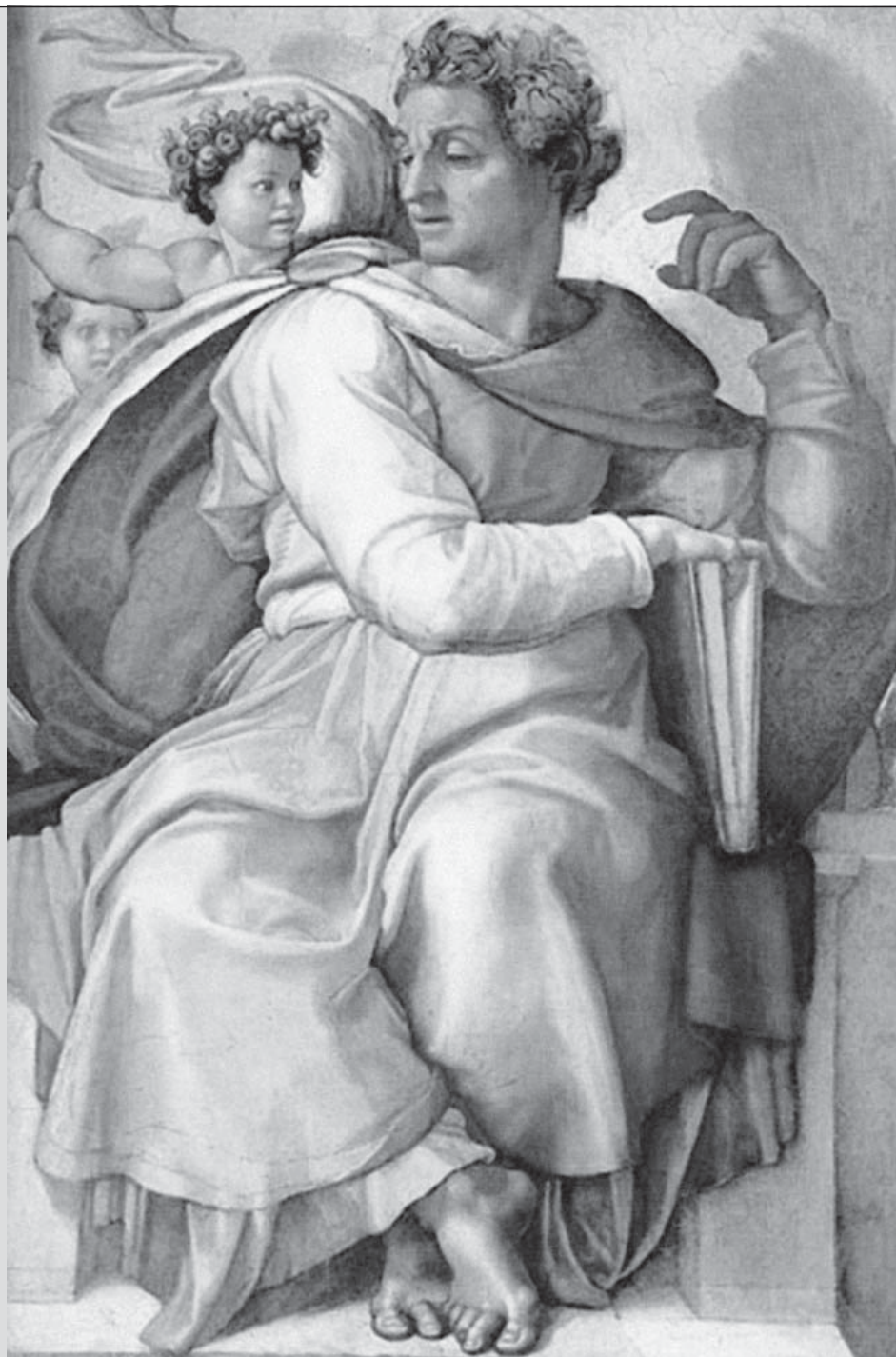
Michelangelo Buonarroti (1475-1564): Prorok Izaiáš