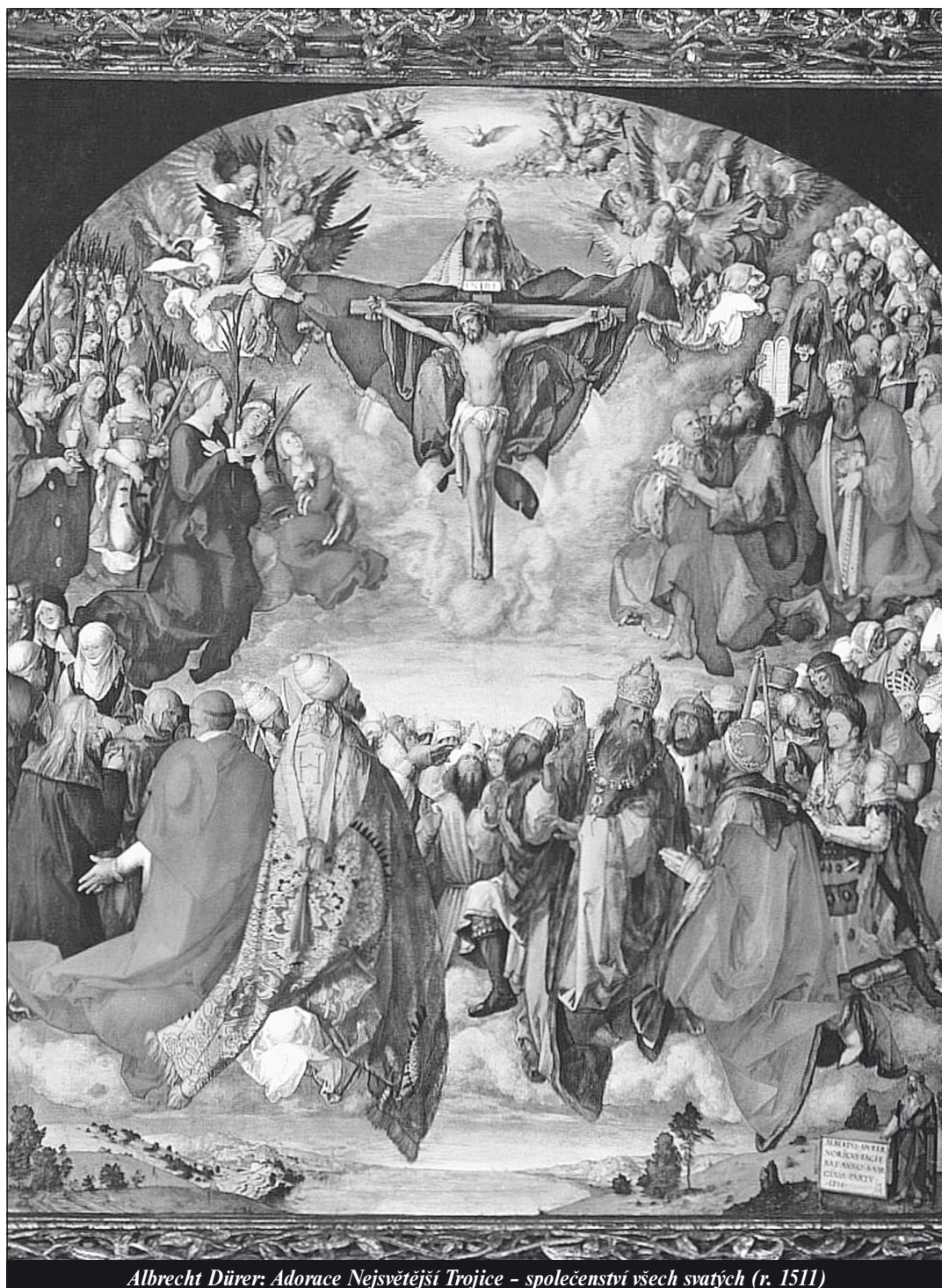
Albrecht Dürer: Adorace Nejsvětější Trojice - společenství všech svatých (r. 1511)

Člověk vděčí za nebe plodnosti Otce - strana 11 -