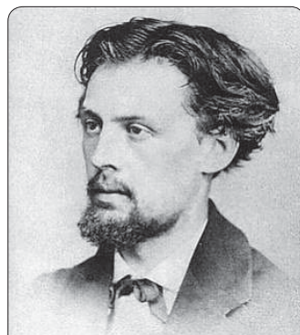
Adam Bernard Chmielowski

Ale řeholní život ho neosvobodil tak, jak to očekával. Propadá se stále hlouběji do spleti řeholních tlaků a bludných myšlenek. Když se zúčastní ignaciánských exercicií, zmocní se ho přesvědčení, že nikdy nebude moci vést život, který by se líbil Bohu, že si zasloužil jen věčné zavržení. Trápí ho drásající sebepoznání. Jeho duše se zmocnila nesmyslná prázdnota odloučenosti od Boha, kterou později popsal takto: Byl jsem plně při smyslech a prožíval jsem opravdové mučednictví: nepojmenovaná úzkost, byl jsem doslova pronásledován strašnými výčitkami