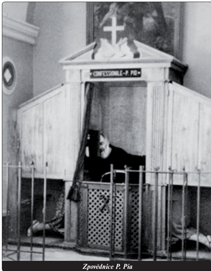
Zpovědnice P. Pia

O třech úkonech kajícíka mluví také KKC v článcích 1450–1460. Na „prvním místě“ stojí lítost. Je to „bolest srdce a odpor ke spáchaným hříchům spojený s pevným rozhodnutím dále nehřešit“ (tridentský koncil DH 1676). „Dokonalá lítost“ vychází z lásky k Bohu a nazývá se také „lítost lásky“. Jestliže se lítost vztahuje na odpor k hříchu a na strach z trestu, jedná se o „lítost nedokonalou“. I ona je Boží dar a postačí k přijetí svátosti smíření. KKC dodává, že je třeba se na zpověď přiměřeně připravit zpytováním svědomí (KKC 1454).