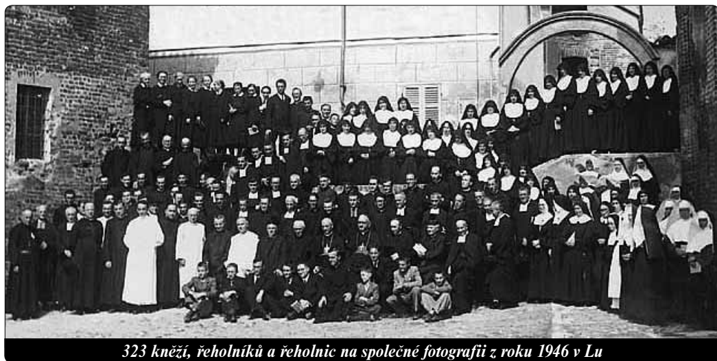
323 kněží, řeholníků a řeholnic na společné fotografii z roku 1946 v Lu

Prosila jsem ho za náš malý noviciát a prosila jsem ho, aby mi dal některé duše, které bych mohla formovat pro něho. On mi odpověděl: „Dám ti duše mužů.“ Mlčela jsem, protože jsem nepochopila ▶