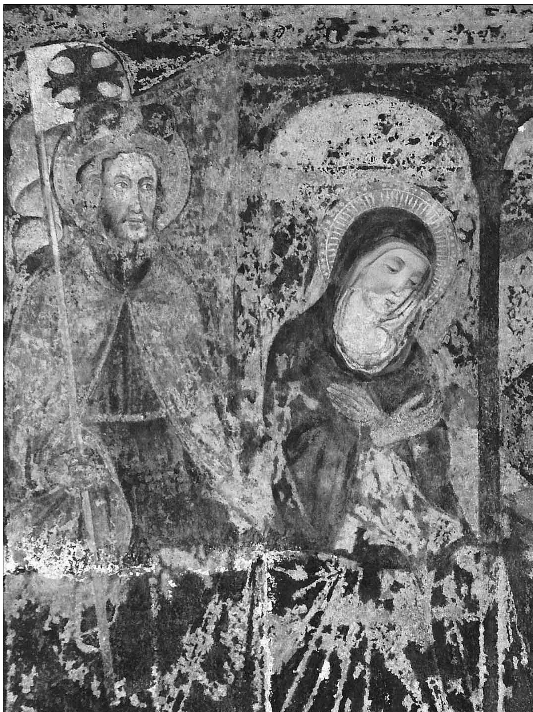
Jedno z nejstarších vyobrazení sv. Václava a sv. Ludmily v atriu St. Maria in Trastevere v Římě