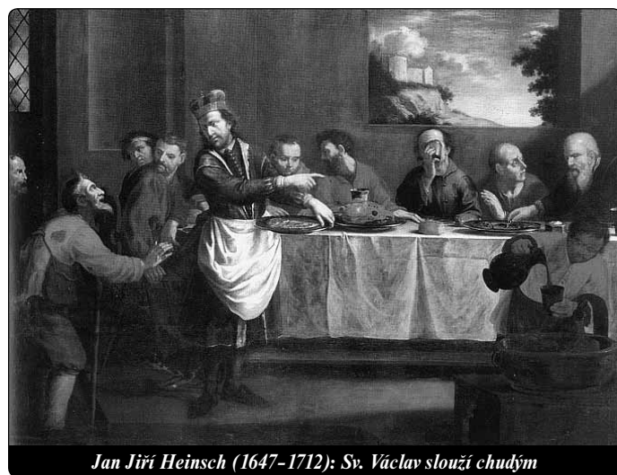
Jan Jiří Heinsch (1647–1712): Sv. Václav slouží chudým

Jakmile tento hoch nápadné sličnosti a roztomilé povahy dospěl jarého věku jinošského, ještě za života otcova přál si býti vzdělán znalostí písma, a když byl častým žadoněním obměkčil srdce otcovo, byl dán s jeho dovolením na hrad Budeč, aby se tu přiučil umění číst. Jelikož pak jeho rozum byl od Boha nadán rychlou chápavostí, naučil se po krátkém studiu důkladně knize žalmů i četným jiným knihám Písma a vše si vštíпил hluboce do