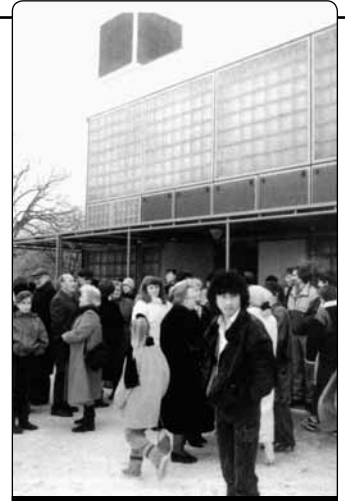
Trondheim – setkání po mši svaté

jsou impulzem k soužití a prožívat takové společenství je bohatství, které jsem za léta působení v Německu takto nepoznal. Jsem vděčen za tyto zkušenosti se slovem „katolická“, což neznamená nic jiného než vše zahrnující, všeobecná.