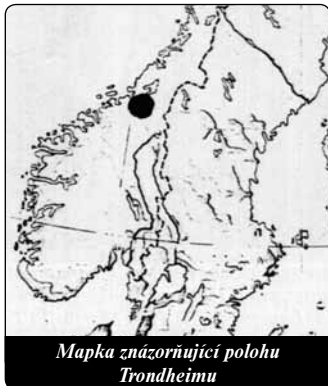
Mapka znázorňující polohu Trondheimu

Situace extrémní diaspory katolické církve v Norsku je pro mnoho zahraničních návštěvníků setkáním se zcela jiným světem. Slyší s úžasem, že biskupství v Trondheimu čítá přesně 1500 katolíků. Nevěřicně krouťí hlavou, když si mají představit, že jednotliví věřící bydlí až