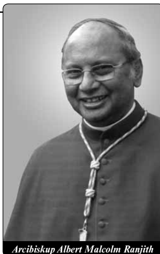
Arcibiskup Albert Malcolm Ranjith