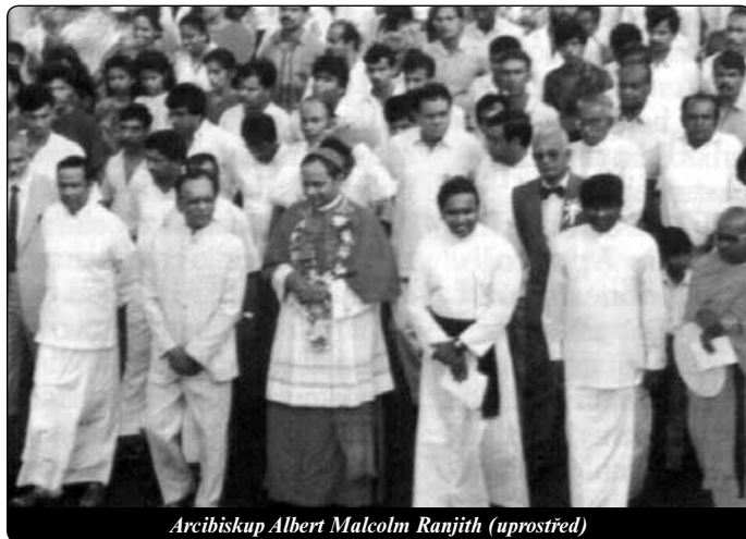
Arcibiskup Albert Malcolm Ranjith (uprostřed)