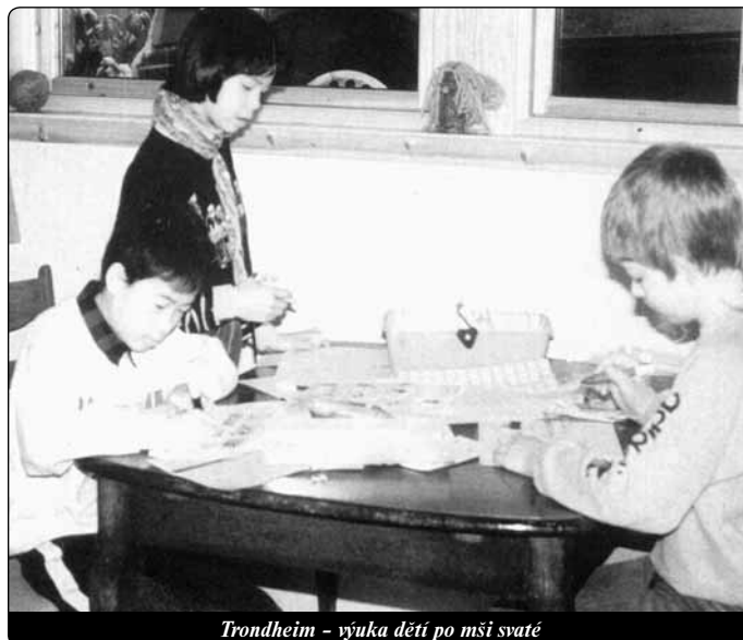
Trondheim – výuka dětí po mši svaté

Mnoho Norů sleduje příliv zahraničních spoluobčanů s nedůvěrou, nevěřivostí a obavami. Ale ptají se také zvláště na to, jak to dělají katolíci. No, není to pouze lidská schopnost. Když lidé ze všech koutů světa zpívají „Gloria“, je zřejmé, že Ježíš je sjednocující silou. Bohoslužby