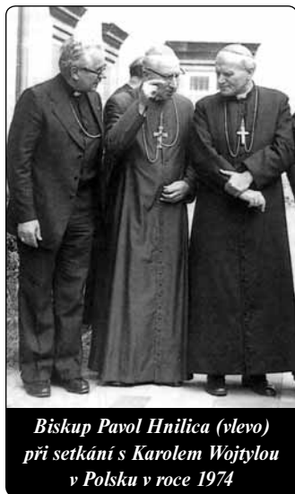
Biskup Pavol Hnilica (vlevo) při setkání s Karolem Wojtylou v Polsku v roce 1974

Slovenští biskupové písemně pověřili Pavla Hnilicu, aby podal zprávu o stavu církve v jejich zemi. Udělili mu k tomu plnou