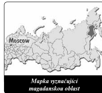
Mapka vyznačující magadanskou oblast

Pater Michael však nežije jen pro vzpomínky. Když přišel do Ruska, divil se, kolik je zde deprese. Nemohl ji však blíže určit. Jednoho dne poznal, že příčinou této tísnivé atmosféry je vysoký počet potratů. Rozhodl se, že bude pomáhat ženám, které by si dítě chtěly ponechat, ale také těm, které už mají potrat za sebou a jejichž duše tím byla těžce zraněna. Ženám, které se rozhodly pro dítě, nabízí se po tři roky pomocná ruka. Někdy se tato pomoc nemůže omezit na oděv, nájemné, elektrinu a výživu, ale jsou potřebné také pancéřové domovní dveře, které je mají chránit před agresivními opilými otci. Dostávají také