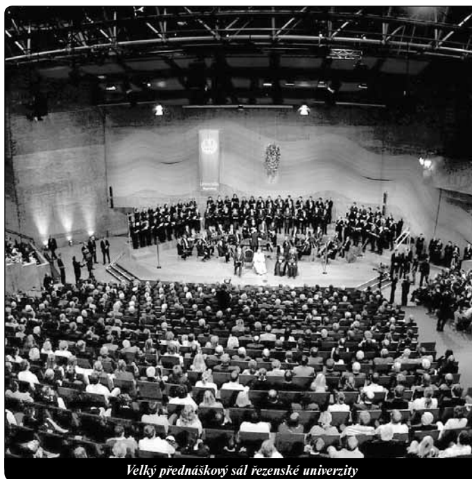
Velký přednáškový sál řízenské univerzity

Liberalní teologie 19. a 20. století přinesla s sebou druhou vlnu v programu dehelenizace, jejímž význačným reprezentantem je Adolf von Harnack. Během mých studií a prvních let mého akademického působení byl tento proud v katolické teologii velice silný. Jako východisko sloužilo Pascalovo rozlišování mezi Bohem filosofů a Bohem Abrahama, Izáka a Jakuba. Ve své nástupní přednášce roku 1959 v Bonnu jsem se snažil čelit tomuto argumentu a nechtěl bych zde všechno opakovat. Chtěl bych se však alespoň ve stručnosti pokusit vyzvednout to nové, v čem se tato druhá vlna dehelenizace liší od té první. Ústřední myšlenkou Harnacka je zřejmý návrat k prostému člověku Ježíšovi a jeho prostému poselství, které by mělo předcházet veškerému teologizování a zejména pak helenizování: Toto prosté poselství má