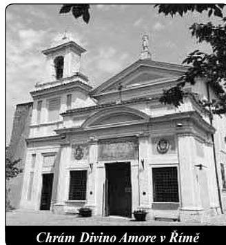
Chrám Divino Amore v Římě

ku. Kolem svatyně především o svatodušních svátcích vyrostla spousta stánků, které prodávaly všechno možné a mísila se tu