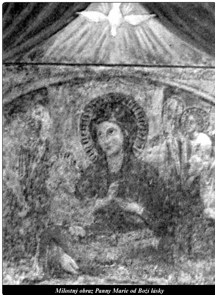
Milostný obraz Panny Marie od Boží lásky

zbožnost s jarmarečným ruchem, který z pouti udělal tzv. „výlet za město“. Tak svatyně upadala, až na začátku 20. století upadla do zapomenutí. Když v roce 1930 připadla do římského vikariátu, stala se svatyně farním kostelem a prvním farářem byl mladý kněz