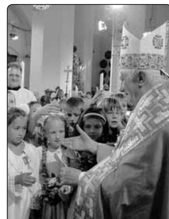
Setkání s dětmi provázela velká srdečnost a radost, každý se chtěl Svatého otce alespoň dotknout...

Po modlitbě nešpor přistoupil papež Benedikt k ambonu a povzbudil všechny, aby se stali „lidmi podle Božích měřítek“. Vysvětlil, že křestní roucho a bílý oděv prvokomunikantů připomínají tuto velkou důstojnost a současně říkají: „Životem s Kristem a ve společenství věřících Církve, staň se jasným člověkem, člo-