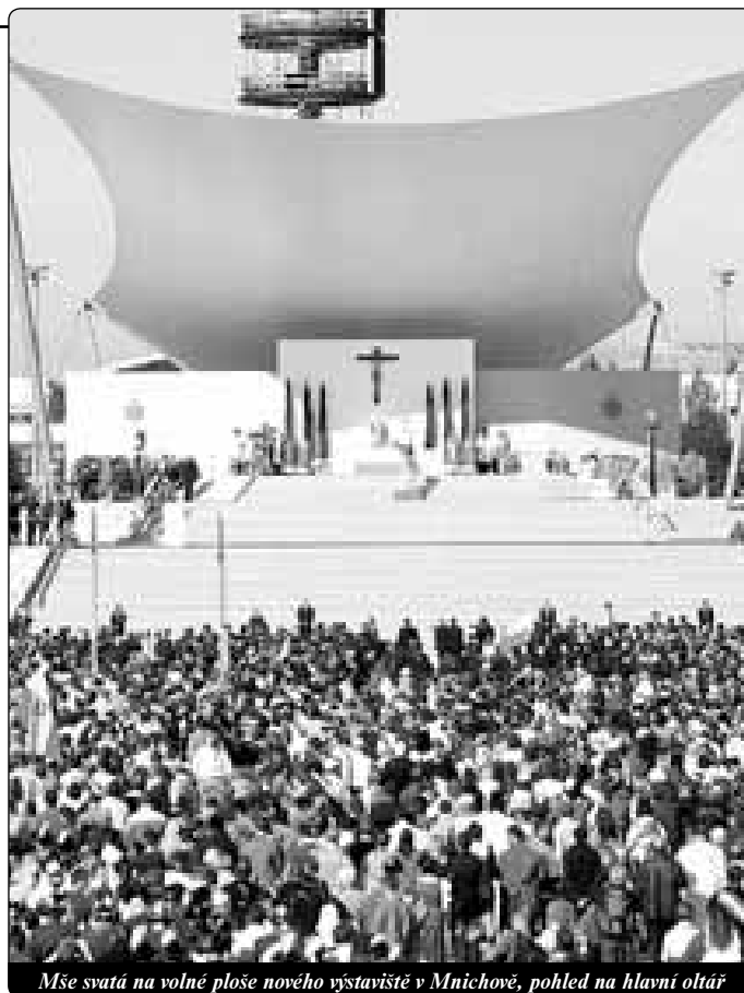
Mše svatá na volné ploše nového výstaviště v Mnichově, pohled na hlavní oltář

Než budeme v této otázce pokračovat, chtěl bych vám vyprávět své zkušenosti ze setkání s biskupy z celého světa. Katolická církev v Německu vyniká svými sociálními aktivitami, svou ochotou pomáhat, kde je třeba. Když přijedou biskupové na návštěvu Ad limina, naposledy to byli někteří z Afriky, vždy znovu mi vyprávějí s velikou vděčností o velkorysosti německých katolíků a prosí mne, abych toto poděkování předal. I biskupové z baltských zemí, kteří u mne byli posledně, mě informovali, jak znamenitě jim němečtí katolíci pomáhali při obnově jejich kostelů, těžce poničených za mno-