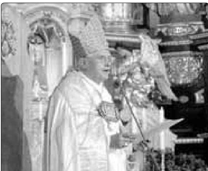
Papež Benedikt XVI. pronášející homilii během nedělní slavnostní mše svaté

Po nešporách se zapsal v bazilice do Zlaté knihy města Altöttingu, kterou mu předložil starosta Herbert Hofbauer. Pak se odebral do svého rodiště Markt am Inn.