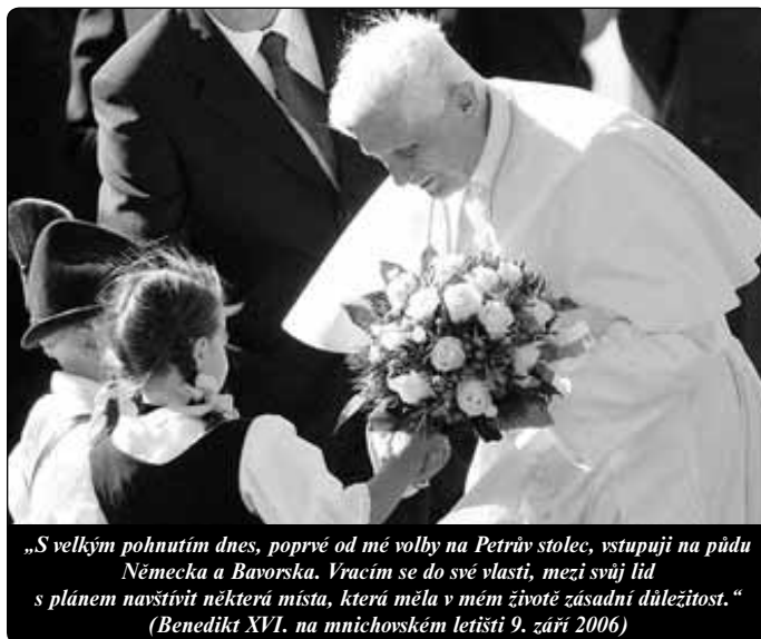
„S velkým pohnutím dnes, poprvé od mé volby na Petrův stolec, vstupuji na půdu Německa a Bavorska. Vracím se do své vlasti, mezi svůj lid s plánem navštívit některá místa, která měla v mém životě zásadní důležitost.“ (Benedikt XVI. na mnichovském letišti 9. září 2006)

Snad se smím při této příležitosti vrátit krátce k myšlence, kterou jsem představil ve své krátké vzpomínce v souvislosti s mým jmenováním arcibiskupem Mnichova a Freisingu. Měl jsem se stát a stal jsem se nástupcem sv. Korbiniána. Již od mého dětství mne okouzlovala jeho legenda, podle níž medvěd roztrhal koně,