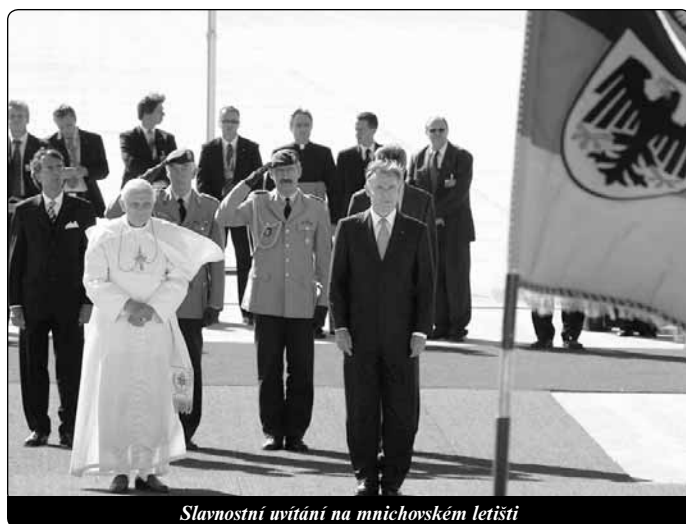
Slavnostní uvítání na mnichovském letišti

Evangelium vypráví, že Ježíš vložil své prsty do uší hluchého, dotkl se slinou jeho jazyka a řekl: „Effatha – otevři se!“ Evangelista nám dochoval původní aramejské slovo, které Ježíš řekl, a tak nás přímo uvádí do tohoto okamžiku. To, co se zde vypráví, je jedinečné, a pře-