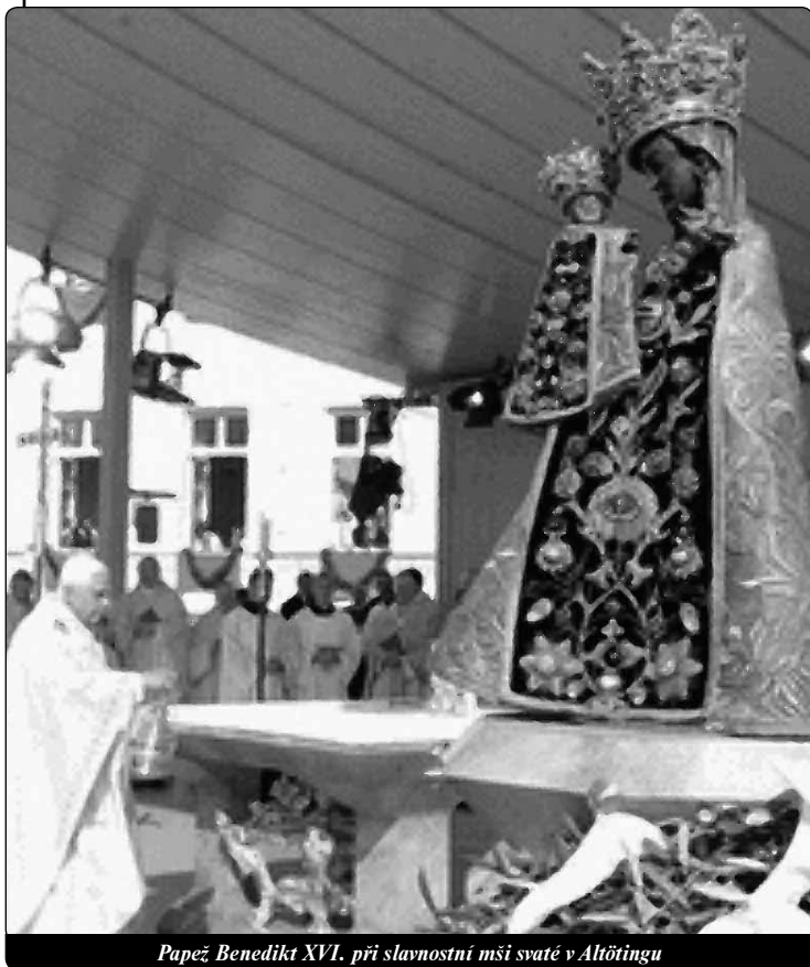
Papež Benedikt XVI. při slavnostní mši svaté v Altöttingu

Po bohoslužbě šel papež v procesi k nové adorační kapli, aby ji požehnal.