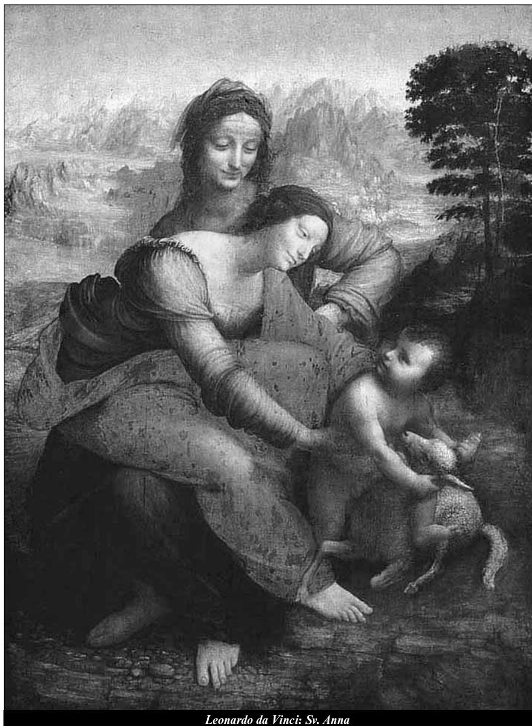
Leonardo da Vinci: Sv. Anna