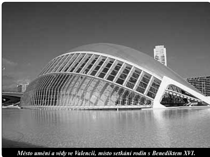
Město umění a vědy ve Valencii, místo setkání rodin s Benediktem XVI.

Na četné žádosti našich čtenářů upozorňujeme, že číslo konta na pomoc obětem tsunami v Indii k článku Tsunami – a co dál? ve Světle č. 28, str. 11 bylo uvedeno na konci následujícího článku Misie svatého Františka Xavera (str. 11, pokrač. na str. 15). Pro přehlednost přetiskujeme potřebnou část textu znovu. Redakce.