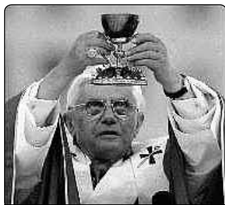
Benedikt XVI. celebruje slavnou mši svatou se Svatým Kalichem

Klášter San Juan de la Pena je situován na úpatí hory Mons Salvatoris (1547 m), v lidové řeči Mont Salvatore. Král Grálu Artuš odpovídá historické postavě krále Alfonse I. (lidově Anforts), který vládl v roce 1104–1134 a každý rok se v postě uchyloval do kláštera San Juan, kde byl tehdy uctíván Santo Caliz. Byl velkým příznivcem řádu templářů, kterému odkázal třetinu svého království, což vysvětluje, proč rytíře sv. Grálu označuje Wolframův Parzival jako templáře. Podobně jako Artuš byl i Alfons I. zraněn v bitvě a přenesen do kláštera San Juan, kde po sedmi dnech zemřel. Jeho památka se zachovala v lidu jako víra, že stále žije a jednoho