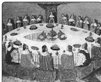
Vyobrazení legendy: Kulatý stůl a rytíři Svatého Grálu

Konečně hrad Svatého Grálu (u Wagnera „Monsalvat“ – v lidové řeči Svatá Hora) odpovídá dopodrobna topograficky i architektonicky klášteru San Juan de la Pena.