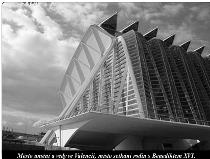
Město umění a vědy ve Valencii, místo setkání rodin s Benediktem XVI.