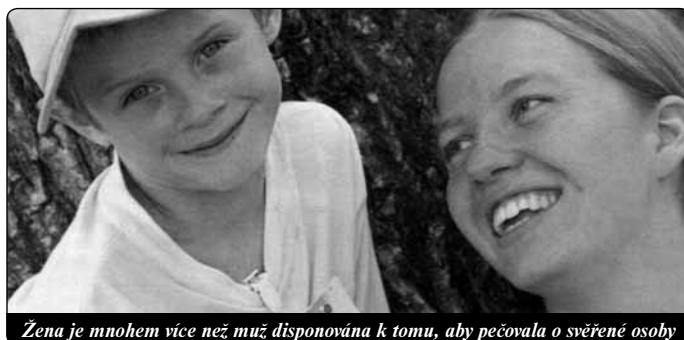
Žena je mnohem více než muž disponována k tomu, aby pečovala o svěřené osoby

Podle knihy Kněžství ženy neboli kněžství srdce