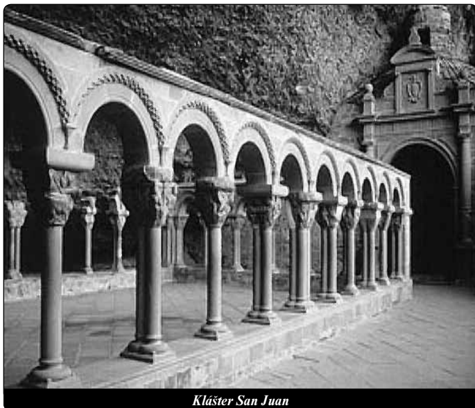
Klášter San Juan