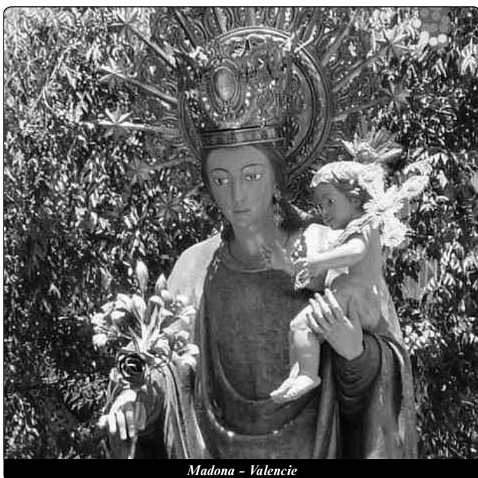
Madona - Valencie