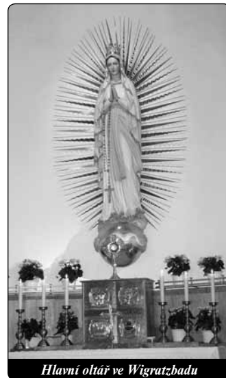
Hlavní oltář ve Wigratzbadu

V neděli ráno jsem hovořil s jednou spolupracovnicí ve Wigratzbadu o noční události. Její bývalá spolupracovnice, která