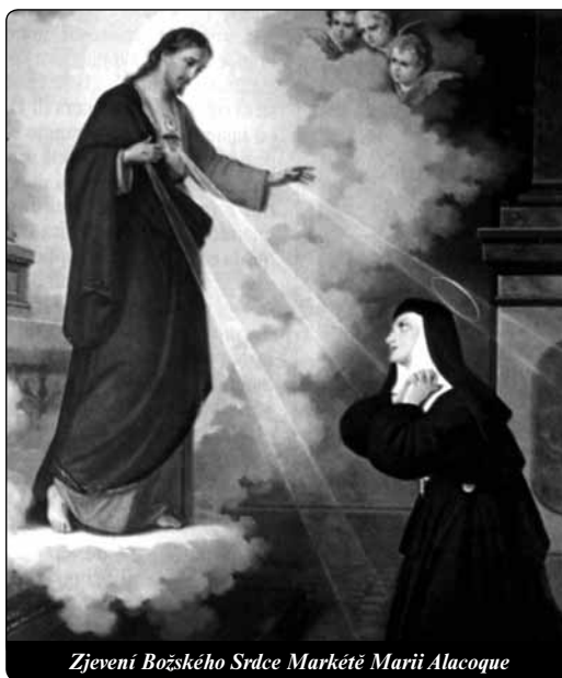
Zjevení Božského Srdce Markétě Marii Alacoque