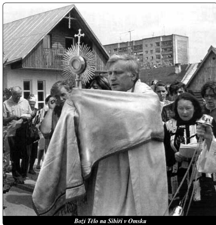
Boží Tělo na Sibíři v Omsku

Z Christ in der Gegenwart 6/2006 přeložil -ls-