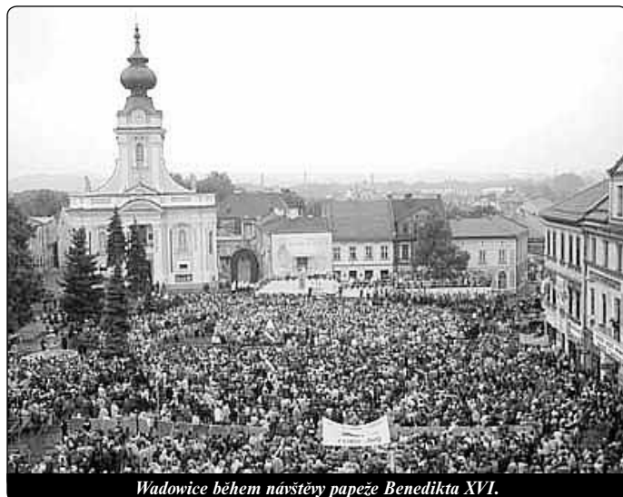
Wadowice během návštěvy papeže Benedikta XVI.

Bollettino Vaticano 31. 5. 2006 Mezititulky redakce Světla