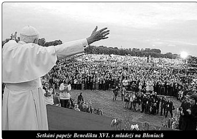
Setkání papeže Benedikta XVI. s mládeží na Błoniach

Budovat na skále znamená budovat na Kristu a s Kristem, který je skála. Svatý Pavel, když mluví v listu ke Korinťanům o putování vyvoleného národa pouští, vysvětluje, že všichni pili z duchovní skály a tou skálou je Kristus (1 Kor 10,4). Jistě, otcové vyvoleného národa neviděli, že tou skálou byl Kristus. Neuvědomovali si, že je provází Ten, který se vtělí, až přijde plnost času. Nemuseli chápat, že jejich žízeň utišoval sám Pramen života, který je schopen živou vodou utišit každou žízeň srdce. Pili však z té duchovní skály, kterou je Kristus, protože toužili po vodě života, neboť ji potřebovali. Když putujeme životem, nejednou si neuvědomujeme Je-