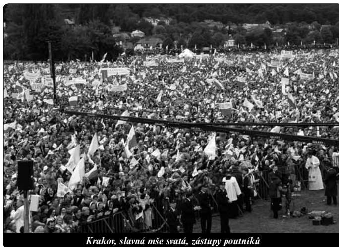
Krakov, slavná mše svatá, zástupy poutníků

Slyšeli jsme dnes Ježíšova slova: Duch Svatý sestoupí na vás, dostanete moc a budeteými svědky v Jeruzalémě, v celém Judsku a Samařsku, ano až na konec země (Sk 1,8). Ta slova dospěla před věky i na polskou zemi a stále představují výzvu pro všechny, kteří se hlásí k Ježíši Kristu a pro které je jeho záležitost tou nejdůležitější. Máme být svědky Ježíše žijícího v Církvi a v lidských srdcích. To on nás posílá. V den nanebevstoupení řekl apoštolům: Jděte do celého světa a hlásejte evangelium všemu stvoření. (...) Učedníci šli a všude kázali. Pán působil s nimi a potvrzoval jejich slova znamením, která je provázela (Mk 16,15.20). Drazí bratři a sestry! Spolu s volbou Karola Wojtyly na stolec sv. Petra, aby sloužil celé Církvi, stala se vaše země místem zvláštního svědectví víry v Ježíše Krista. Vy sami jste byli povoláni, abyste vydávali svědectví před celým světem. Toto vaše povolání je nadále aktuál-