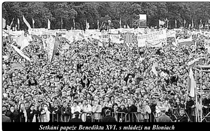
Setkání papeže Benedikta XVI. s mládeží na Bloniac

Draží přátelé, a ještě jednou: Co to znamená budovat na skále? Budovat na skále znamená budovat na Petrovi a s Petrem. Jemu přece Pán řekl: Ty jsi Petr, skála, a na té skále postavím svou církev a brány pekla ji nepřemohou (Mt 16,16). Jestliže Kristus,