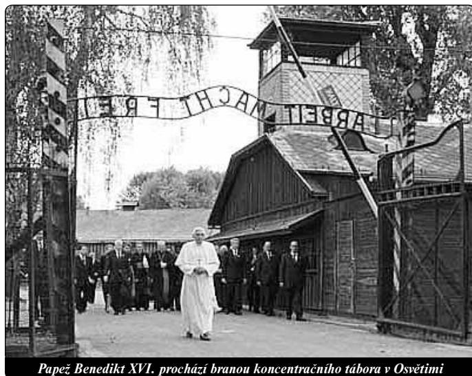
Papež Benedikt XVI. prochází branou koncentračního tábora v Osvětimi

ny setkání s mládeží. Využil jsem této příležitosti, abych obnovil uprostřed polského lidu hlásání úžasné křesťanské pravdy o člověku, stvořeném a vykoupeném v Kristu; je to pravda, kterou Jan Pavel II. tolikrát důrazně hlásal