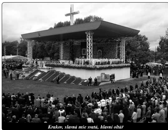
Krakov, slavná mše svatá, hlavní oltář

cem vracel ke kořenům, k pramenům své víry a své služby v Církvi. Odtud viděl Krakov a celou církev. Při první pouti do Polska 10. června 1979 na závěr své homilie zde na pláni řekl s nostalgií: „Dovolte mi, než odejdu, podívat se na Krakov, na ten Krakov, ve kterém je mi drahý každý kámen a každá cihla – a odtud se podívat na Polsko...“ A při poslední mši svaté, kterou slavil na stejném místě 18. srpna 2002, řekl v homilii: „Jsem vděčný za pozvání do mého Krakova a za pohostinnost.“ Toužím učinit tato slova svými slovy a opakovat dnes: Děkuji vám z celého srdce „za pozvání do mého Krakova a za pohostinnost“. Krakov Karola Wojtyly a Krakov Jana Pavla II. je rovněž mým Krakovem! Je Krakovem, který je drahý srdci nesčíslné říše křesťanů na celém světě, kteří vědí, že Jan Pavel II. přišel na vatikánský pahorek z pahorku wawel-