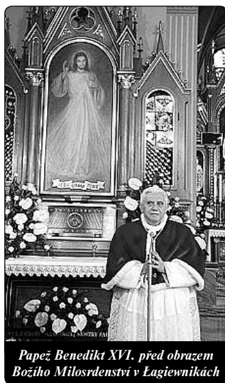
Papež Benedikt XVI. před obrazem Božního Milosrdenství v Łagiewnikách

Skála, drahocenný a živý kámen, nazývá svého apoštola skálou, znamená to, že chce, aby Petr – a s ním i celá církev – byl viditelným znamením jediného Pána a Spasitele. Zde v Krakově, v milovaném městě mého předchůdce Jana Pavla II., slova o budování na Petrovi jistě nikoho neudivují. Proto vám říkám: nebojte se budovat svůj život v církvi a s církvi. Buďte hrdí na svou lásku k Petrovi a k církvi, která mu byla svěřena. Nedejte se