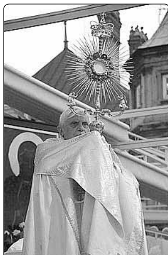
Jasná Hora, slavnostní požehnání

ží, tím víc jej opatruje i využívá. Naopak, nezná-li jeho nesmírnou cenu, snadno o něj přijde, nebo dokonce odloží jako něco bezcenného. Moderátoři programu a animátoři bohoslužeb dovedli skvěle vtahovat do Božích tajemství a probouzet odpovědi srdce na Boží nabídky. Ano, to může být právě jeden z kořenů živé víry v tomto národě. Tady se k víře vychovává, tady se víra předává a dobře pěstuje.