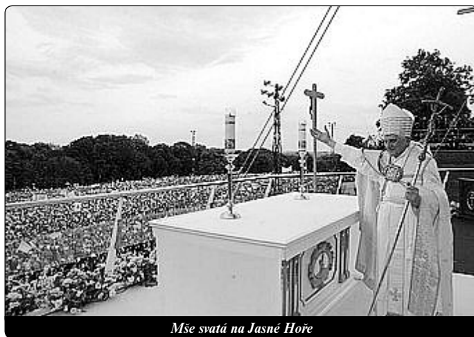
Mše svatá na Jasné Hoře

U nás jsme zvyklí na tvrzení, že víra je dar od Boha a člověk ho nemůže jinému dát. Nebo se víra považuje za něco tak intimního, že je skoro neslušné ji projevovat. Vždyť, co by si řekli lidé? Nechceme být považováni za fanatiky. Musíme respektovat svobodu nevěřících. Jsme opatrní. Nebo se vymlouváme na nevěřící většinu kolem nás.