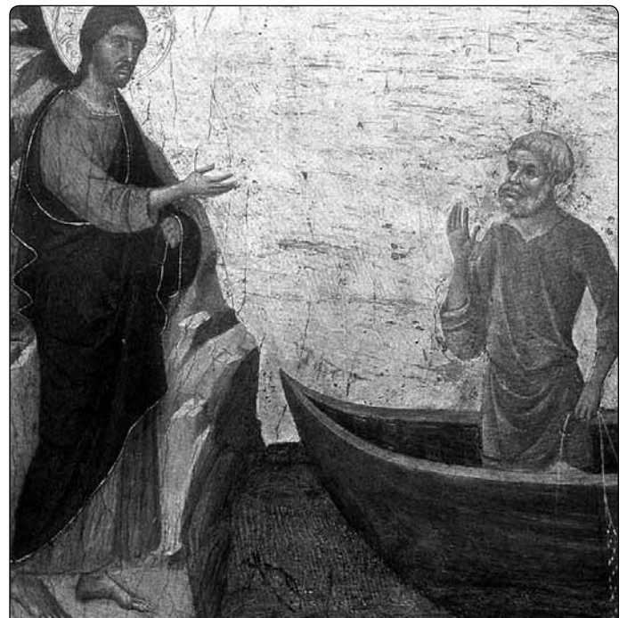
Duccio di Buoninsegna (1255-1319): Ježíš a Petr, detail obrazu Povolání apoštolů Petra a Ondřeje, Národní galerie ve Washingtonu