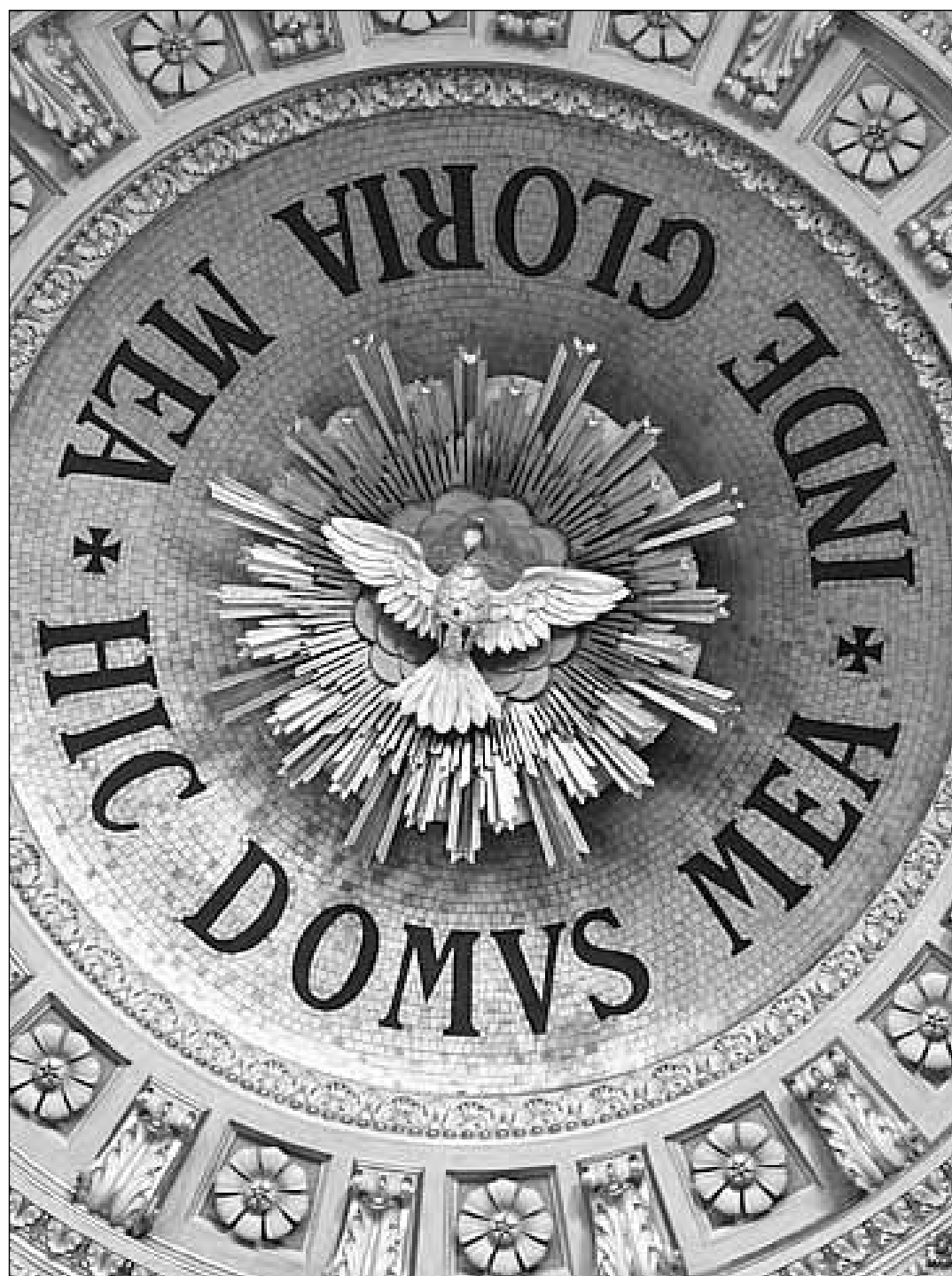
Kopule chrámu Panny Marie, Pomocnice křesťanů v Turíně