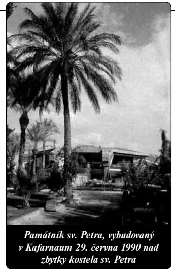
Památník sv. Petra, vybudovaný v Kafarnaum 29. června 1990 nad zbytky kostela sv. Petra

A zdá se mi, že tato různá obrácení svatého Petra a celá jeho postava jsou velkou útěchou a velkým poučením pro nás. I my máme touhu po Bohu, i my