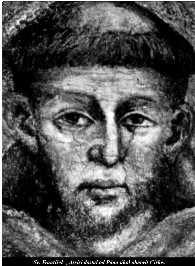
Sv. František z Assisi dostal od Pána úkol obnovit Církev

Silně rozšířenou mentalitou našich dnů, která brání přistupovat k Církvi jako ke svaté, je perfekcionismus. Čím méně lidé uznávají s pokorným srdcem svoji vlastní hříšnost, čím méně přiznávají své vlastní chyby, aby prosili o Boží milosrdenství, tím více se šíří lidský perfekcionismus. Perfekcionismus je dokonalost podle lidských měřítek. Vyjadřuje se v nedosažitelných ideálních představách a přehnaných nárocích na druhé i na sebe, na nositele úřadů, na odpovědné v Církvi a na jiné instituce. V pohledu na Církev se perfekcionismus projevuje jako neuvážená reformní horlivost, která nestaví na věrnosti k původu, nýbrž chtěla by Církev změnit podle vlastních představ. Perfekcionista a perfekcionista laděný věřící podrobují svou zkušenost v Církvi a s Církvi přísně-