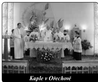
Kaple v Ořechově

její kostel. Tento slib byl navzdory překážkám splněn. Moderní chrám s přílehlým ústavem a oratoří vyrostl v rekordně krátké době a v den jeho posvěcení nebyla stavba zatížena ani korunou dluhu.