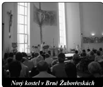
Nový kostel v Brně Žabovřeskách

Komunistickým režimem internovaní a uvězněni salesiáni složili Panně Marii slib, že po návratu z vězení vybudují v Brně Žabovřeskách