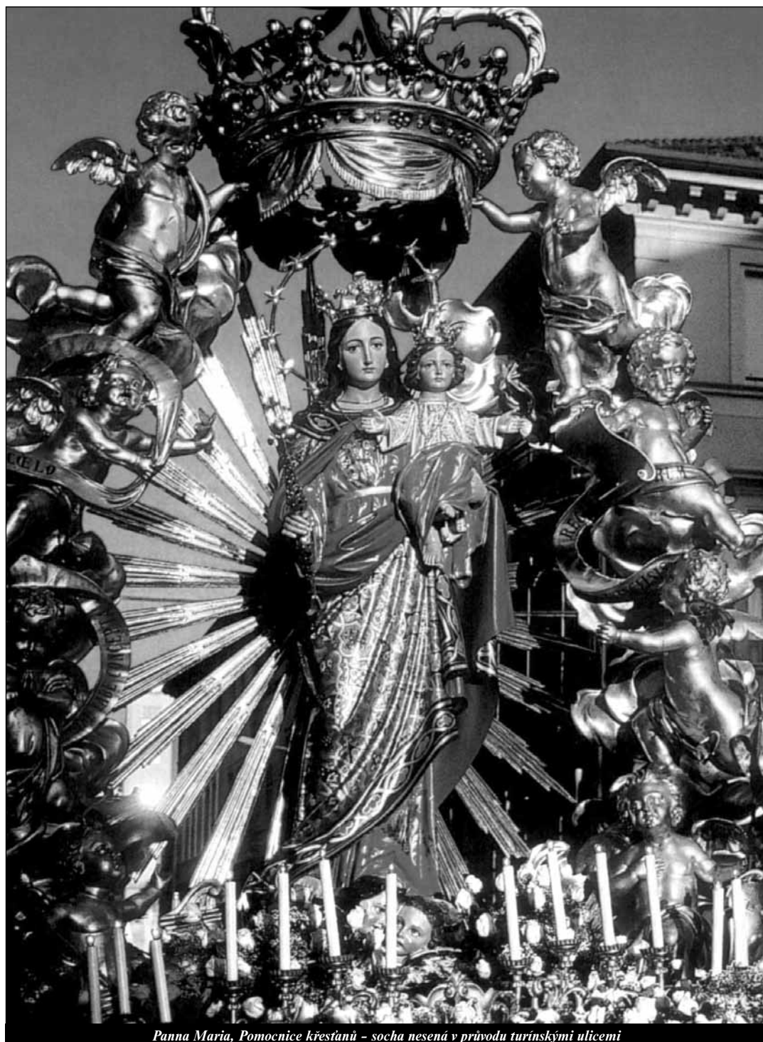
Panna Maria, Pomocnice křesťanů - socha nesená v průvodu turínskými ulicemi

Výzvy fatimského poselství (57) Četba na pokračování - strana 22 -