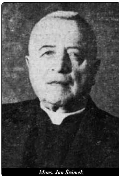
Mons. Jan Šrámek

Tento stát jsme si zbudovali jako zástitu a tvrz, jako ručitele našich osobních práv, nikoliv jako tyrana, který požívá, co nezbudoval. Uvnitř tohoto státu žádáme proto sociální mír, sociální spravedlnost, právní jistotu