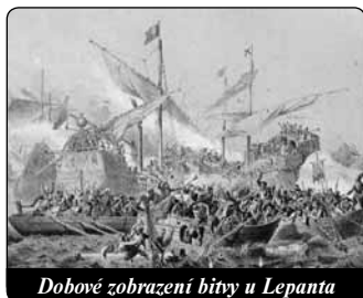
Dobové zobrazení bitvy u Lepanta

O ctnostech, životě, předurčení, mateřství, prostřednictví, přimluvě, panenství, neposkvrněném početí, vytrpěných bolestech a nanebevzetí Panny Marie byly napsány stovky knih, byly předmětem koncilů, prohlášený za články víry a vznikla tak zvláštní teologická nauka zvaná mariologie.