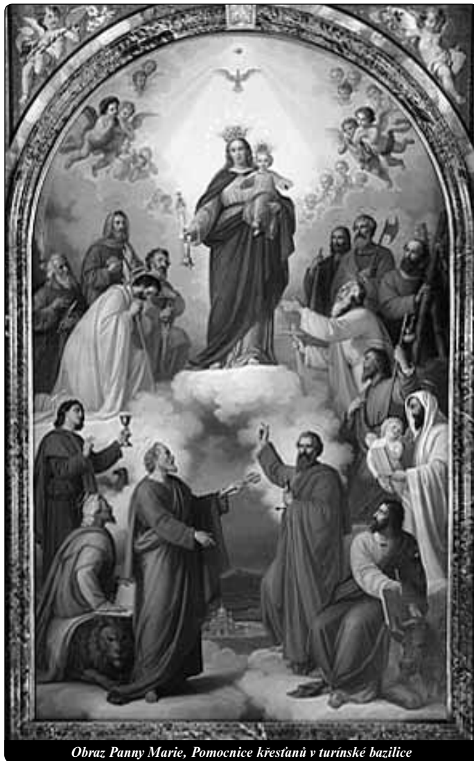
Obraz Panny Marie, Pomocnice křesťanů v turínské bazilice