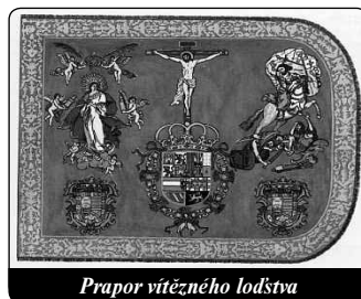
Prapor vítězného loďstva

Tento velký světec a vychovatel postavil od počátku své dílo pod ochranu Panny Ma-