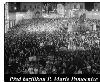
Před bazilikou P. Marie Pomocnice

Panny Marie, Pomocnice křesťanů pro Řím a Itálii. Pontifikát tohoto papeže spadá do obtížného období, kdy Církev ve Francii a Itálii prožívala katastrofální důsledky Francouzské revoluce. Církev byla ve Francii zcela rozvrácena. V jednání s Napoleonem Bonapartem bylo v roce 1801 nakonec dosaženo konkordátu, který sice uznával, že většina Francouzů jsou katolíci, ale katolická církev byla odloučena od státu. Roku 1804 donutil Napoleon Pia VII., aby ho korunoval císařem, což vedlo k rostoucímu napětí. V roce 1806 Napoleon prohlásil, že