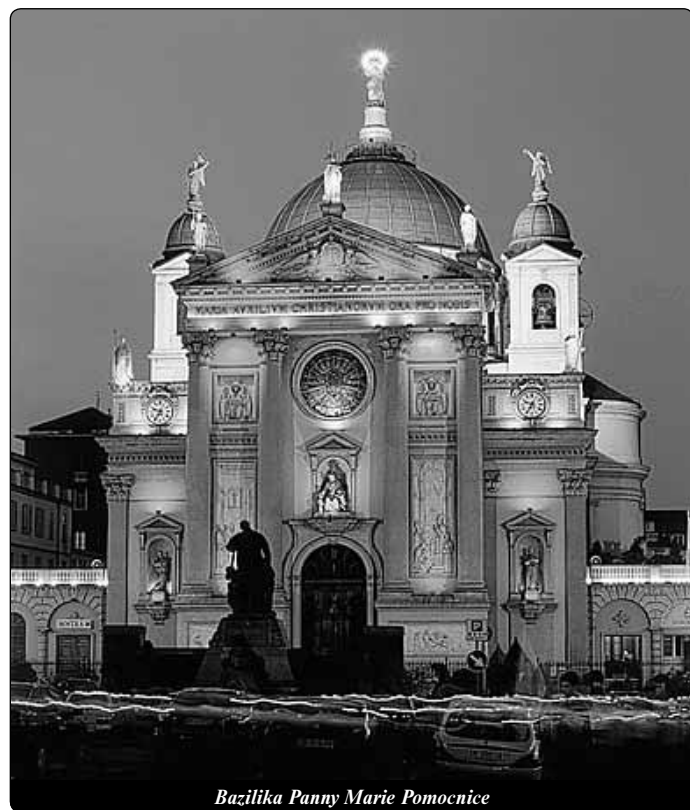
Bazilika Panny Marie Pomocnice