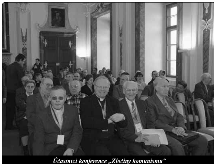
Účastníci konference „Zločiny komunismu“