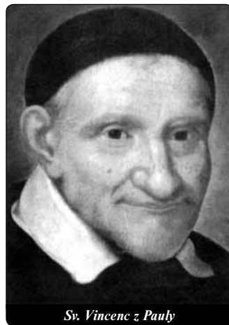
Sv. Vincenc z Pauly

Ježíš nás vyzývá, abychom druhé nesoudili , abychom sami nebyli souzeni. Sváté Kateřině Sienské doporučil, aby neposu-