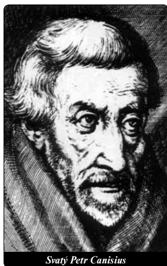
Svatý Petr Canisius

voj mezi křesťany v Korintu pro jejich hříšnost. Živý vztah k Bohu nás těší a osvobozuje od falešných idealizovaných představ