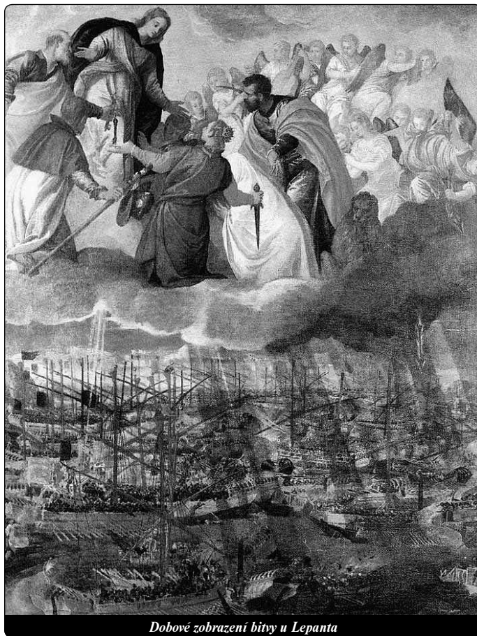
Dobové zobrazení bitvy u Lepanta

V roce 1814 ustanovil Pius VII. 24. květen jako svátek