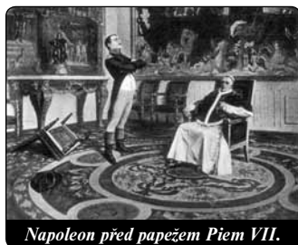
Napoleon před papežem Piem VII.

láci nápis pod velký obraz, který připomíná bitvu u Lepanta: „Ani síla, ani zbraně, ani vojévůdci nás nepřivedli k vítězství, nýbrž Růžencová Panna.“ A tak