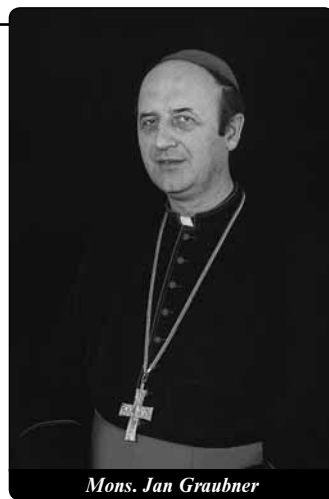
Mons. Jan Graubner

a ochranu, podporu a vážnost rodiny a manželství, svobodu osobní, svobodu vyznání a školy, všestrannou ochranu sociální proti zneužití svobody silnějším vůči slabšímu, zabezpečení spravedlivé mzdy rodinné, ochranu a bezpečnost hmotných statků vzniklých a nashromážděných poctivou prací. Stát je pro lidi, nikoliv lidí pro stát. Stát nesmí překážet, ale má všude pomáhat.