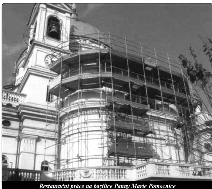
Restaurační práce na bazilice Panny Marie Pomocnice