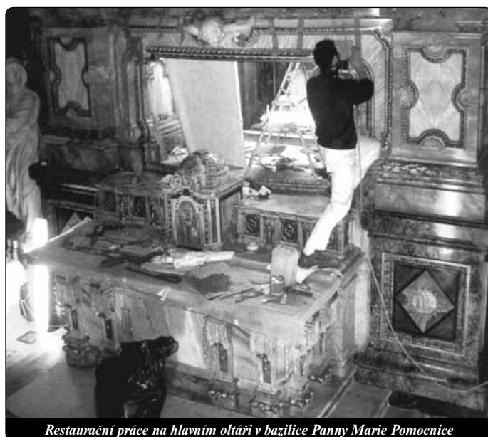
Restaurační práce na hlavním oltáři v bazilice Panny Marie Pomocnice