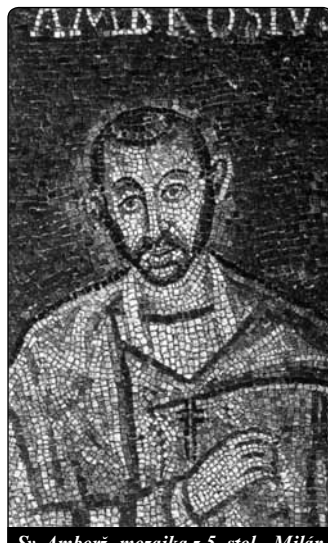
Sv. Ambrož, mozaika z 5. stol., Milán

Jeho závistivost nezná ochotu k pokoře, nýbrž žár žádostivosti (2,8). Jedná se o jednu z forem bláznovství. Stejně tak bláznivá je zlost Achaba, když mu Nábót odmítl odevzdat vinici, takže nejí a nespí. Zcela jiný je půst chudého, „který nic nemá a nikoliv dobrovolně a jen pro Boha, nýbrž z nezbytnosti se postí“ (4,16).