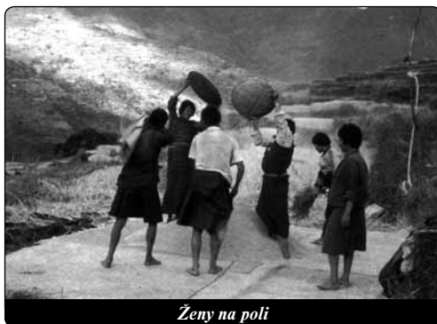
Ženy na poli

Vraťme se však k jeho Nábotovi, který obsahuje na první pohled sociální motiv. Tím skutečně chudým je boháč nebo také naopak. Boháče je ve skutečnosti k politování chudý, protože baží po něčem, co patří jinému.