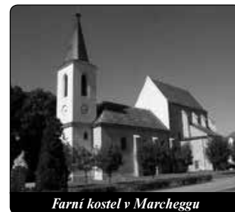
Farní kostel v Marcheggu