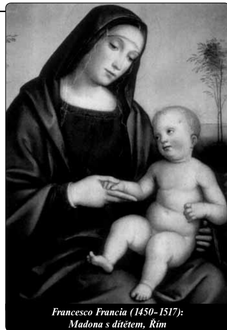
Francesco Francia (1450-1517): Madona s dítětem, Řím

Takže ta, která je matkou Kristovou, je matkou naší moudrosti, matkou naší spravedlnosti, matkou našeho posvěcení a našeho vykoupení. A tak je naší matkou více než matka pozemská. Naše narození z ní je jistě přednější, protože z ní vychází naše svatost, naše moudrost, naše spravedlnost, naše posvěcení a naše vykoupení.