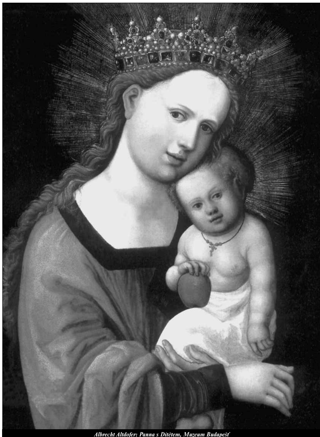
Albrecht Altdorfer: Panna s Dítětem, Muzeum Budapešť