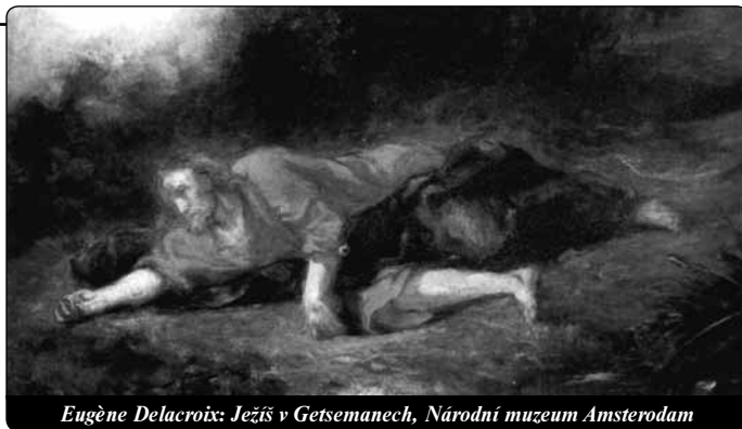
Eugène Delacroix: Ježíš v Getsemanech, Národní muzeum Amsterdam

Bůh.“ Hlas „Poslouchejte ho“ potvrzuje to, co řekl Ježíš, a tentokrát Petr a učedníci poslechnou. Sestupují z hory a naslouchají Ježíši. Neřeknou nikomu, co se stalo na hoře, dokud nevstane z mrtvých.