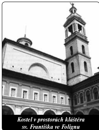
Kostel v prostorách kláštera sv. Františka ve Folignu

Spolu s blahoslavenou Pasqualinou z Foligna shromáždila kolem sebe malý kroužek „synů“, kteří v ní nacházeli duchovní matku a opravdovou učitelku při poznávání cesty kříže a také příklad a oporu, aby nastoupili cestu chudoby a modlitby. Anděla zemřela 4. ledna 1309 a její památka a nauka přetrvala věky. Mezi mnohými, kteří ji poznali a ocenili její poselství, jme-