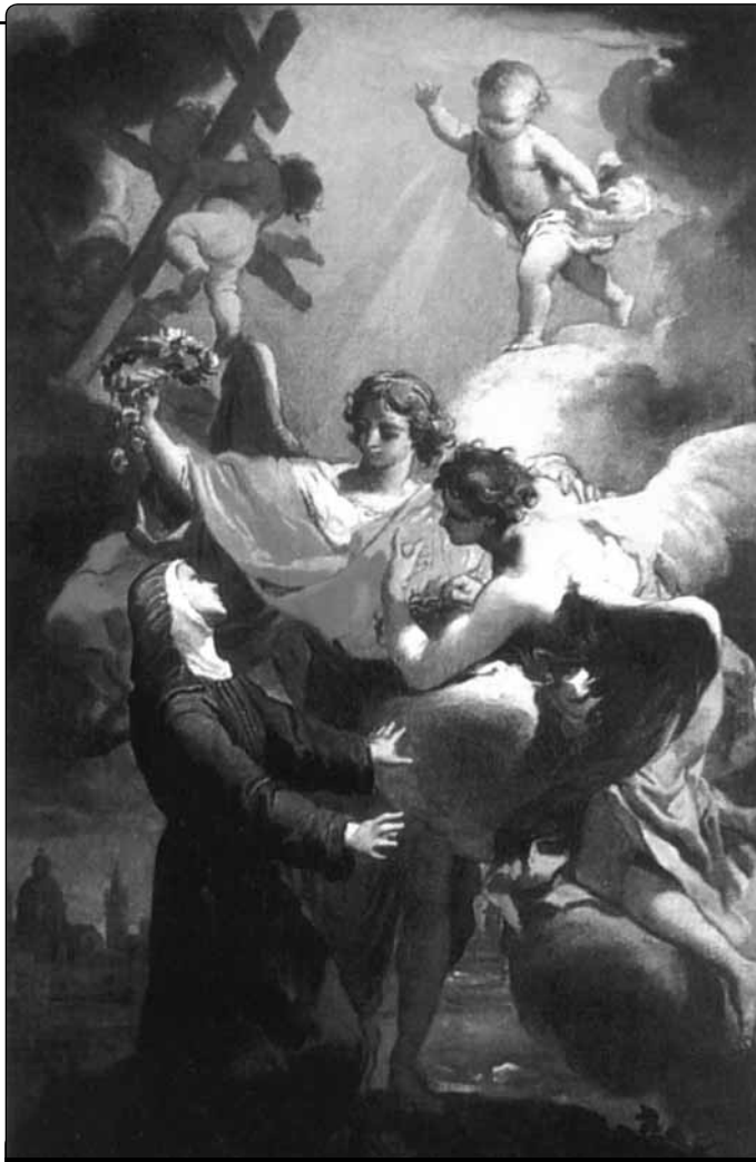
G. Gandolfi (r. 1734): Extáze blah. Anděly z Foligna, chrám sv. Františka

Anděla spatřila světlo světa ve Folignu v roce 1248 v zámožné rodině. Ona sama žila v blahobytu a v časných potěšeních. Víme také s jistotou, že byla vdaná, měla děti a žila se svou matkou, která uspokojovala všechny její vrtochy, jak sama říká. V tu dobu došlo k velkému rozkvětu třetího řá-