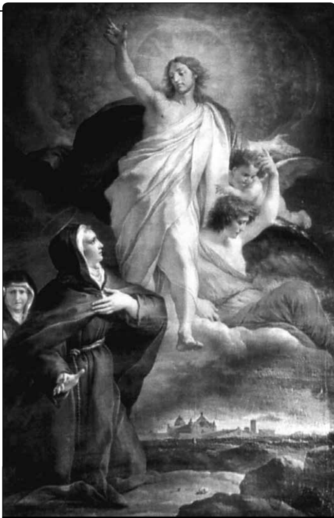
G. Cades (1750–1799): oltářní obraz blah. Anděly z Foligna, chrám sv. Františka

Žádný člověk se nespasí bez Božího světla, které působí, aby někdo začal, pokračoval a dosáhl vrcholu dokonalosti. Proto chceš-li začít tuto cestu a toužíš po tomto světle, pros o to.