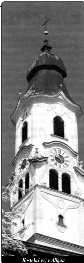
Kostelní věž v Allgäu

Bůh chce, abych miloval muslimy jako své bratry, „jako sám sebe“. Mimoto mě zavazuje poskytnout jim svobodu, aby žili podle svých náboženských představ, i podle těch, které jsou nesprávné.