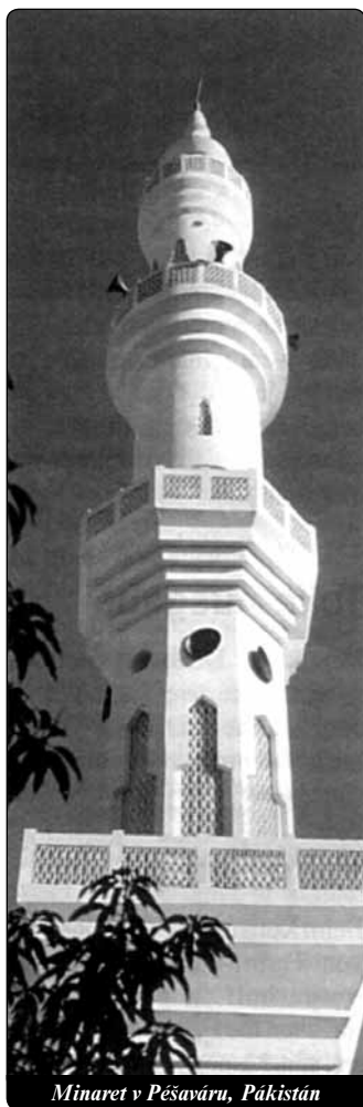
Minaret v Pěšaváru, Pákistán

Hlavní obtíží při řeči o islámu je otázka, o čem je vlastně řeč a co se klade především na váhu kritického hodnocení: Korán? Šaria – muslimský zákon? Mohamedův život? Dějiny islámu? Motivy dnešních teroristů? Praxe některých muslimských států? Máme se přitom dívat spíše na Saúdskou Arábii, nebo na