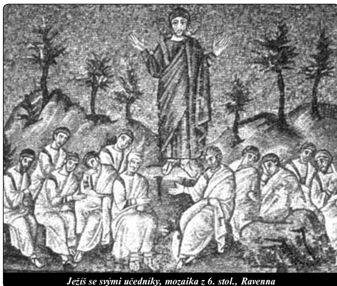
Ježíš se svými učedníky, mozaika z 6. stol., Ravenna

Ježíš a učedníci jsou tak zaneprázdnění apoštolátem, že nemají ani čas, aby se najedli. Nadšení, které dosahovalo vrcholu, je najednou zmrazeno dvěma pomluvami proti Ježíši: pomátl se, je posedlý zlým duchem . Kritika chce všemožným způsobem Ježíše znemožnit. Jednoho dne tomu tak bude i s námi, budou nás veřejně osočovat, napadat, jako bychom byli zločinci, a to kvůli Synu člověka (Lk 6,22). Proto je dobré pozorovat Ježí-