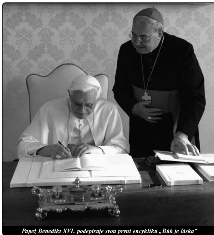
Papež Benedikt XVI. podepisuje svou první encykliku „Bůh je láska“

V lásce k Bohu zakořeněná láska k bližním není jen úkolem pro jednotlivé věřící, nýbrž také pro celé církevní společenství, jehož charitativní působení má být zrcadlem trinitární lásky, zdůrazňuje římský biskup v druhém díle své encykliky, v kterém jde o „praktikování lásky Církve jakožto společenství lásky“. Vědomí tohoto úkolu hrálo od počátku v Církvi podstatnou roli (srov. Sk 2,44–45) a velmi brzy bylo zřejmé, že účinné splnění tohoto úkolu vyžaduje určitou organizaci. Tak došlo ve struktuře Církve k založení diakonie jakožto společensky a spořádaně prováděné služby bliženské lásky v konkrétní a současně duchovní službě (srov. Sk 6,1–6). S postupným rozšiřováním Církve osvědčila se tato praxe bliženské lásky jako její podstatný rys. Vnitřní povaha Církve je vyjádřena jako trojí úkol: hlásání Božího slova („kerygma-martyria“), slavení svátostí („leiturgia“) a služba bližním („diakonia“). Jsou to úkoly, které se vzájemně podmiňují a není je možno od sebe oddělovat. „Služba lásky není pro Církev jakýmsi druhem dobročinnosti, kterou je