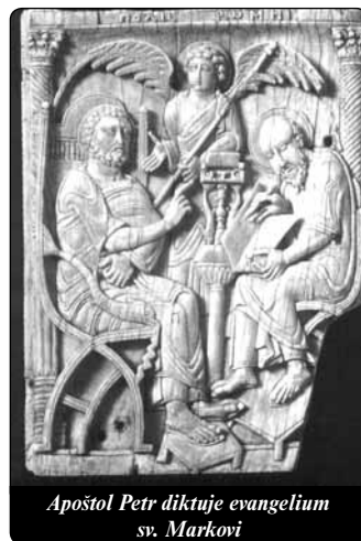
Apoštol Petr diktuje evangelium sv. Markovi

V následujících kapitolách (až do 10.) Ježíš není nikdy sám. Vždy ho doprovázejí jeho