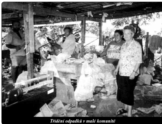
Třídění odpadků v malé komunitě

Na otázku, zda někdy litovala, že šla za svým povoláním do Brazílie, spontánně, téměř dotčena odpovídá: „Ne, nikdy, jsem velice vděčná za všechno, co jsem za těch 31 let prožila. Když jsem zde v Rakousku, těším se z dovolené ve vlasti. Ale pak přijde opět touha po Brazílii a mých lidech. Velice ráda jedu zase zpátky. Není nic