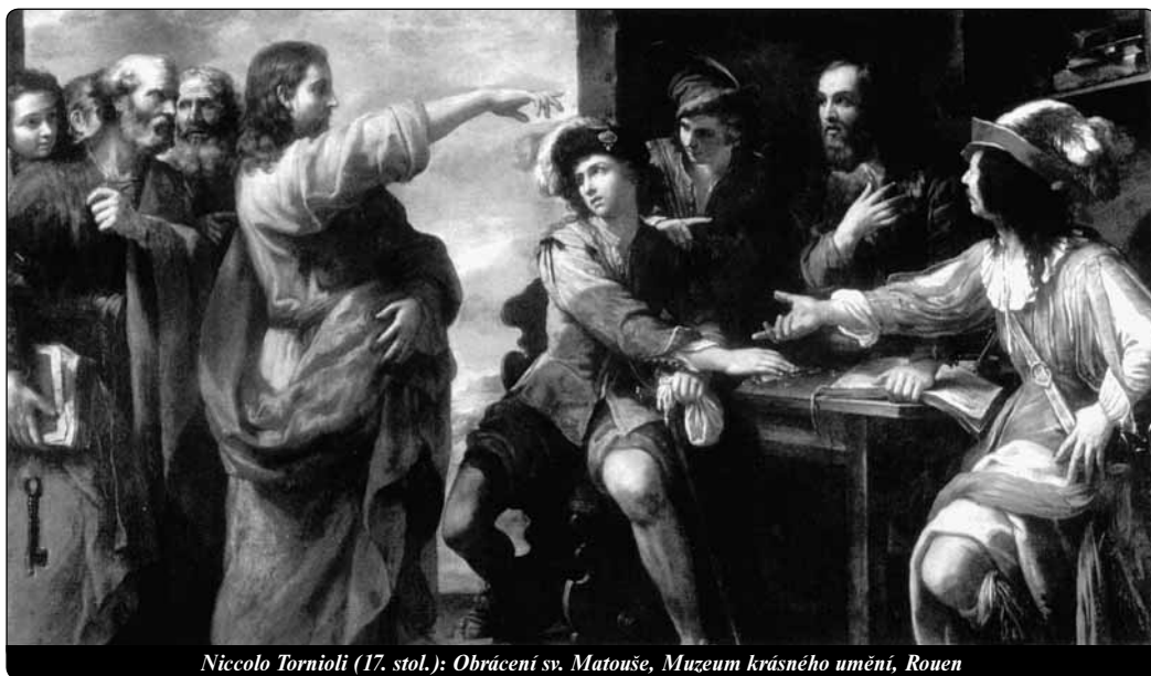
Niccolò Tornioli (17. stol.): Obrácení sv. Matouše, Muzeum krásného umění, Rouen

Ježíš znamená ihned překvapení. V textu se nemluví o tom, co Ježíš učil onu sobotu, ale