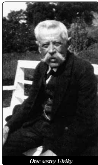
Otec sestry Ulriky