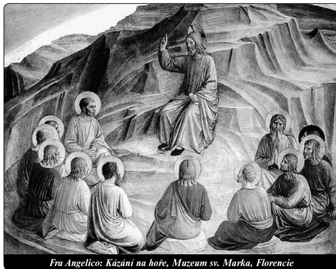
Fra Angelico: Kázání na hoře, Muzeum sv. Marka, Florencie