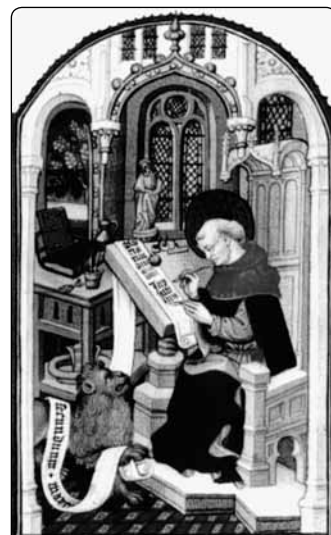
Evangelista sv. Marek (Kodex U.6.7., Modena)

Pohledme pozorně na Ježíše: z vlastní iniciativy vstupuje neočekávaně do života Petra, Ondřeje, Jakuba a Jana. A oni, jakmile zaslechli jeho volání, ihned zanechali všeho a následovali ho. Jeho příkaz doprovází slib, který se týká budoucnosti: Udělám z vás rybáře lidí . Přitomné – následuj mě – se tedy netýká bezprostředního úkolu, ten bude plně záviset na osobě povolání. Nenavrhuje definitivní program a nijak se nezabývá vysvětlováním, co to znamená být „rybářem lidí“. Nevysvětluje, jak se mají podílet na jeho cestě. Chce jen, aby šli za ním . On sám