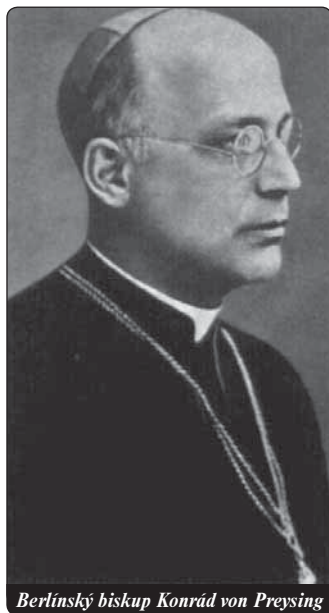
Berlínský biskup Konrád von Preysing

A není zřetelným důkazem tohoto uznání „nedocenitelných záskuh“ o nebojácnou obhajobu Církve a lidských práv proti násilným aktům nacismu kardinálský purpur, který von Galen