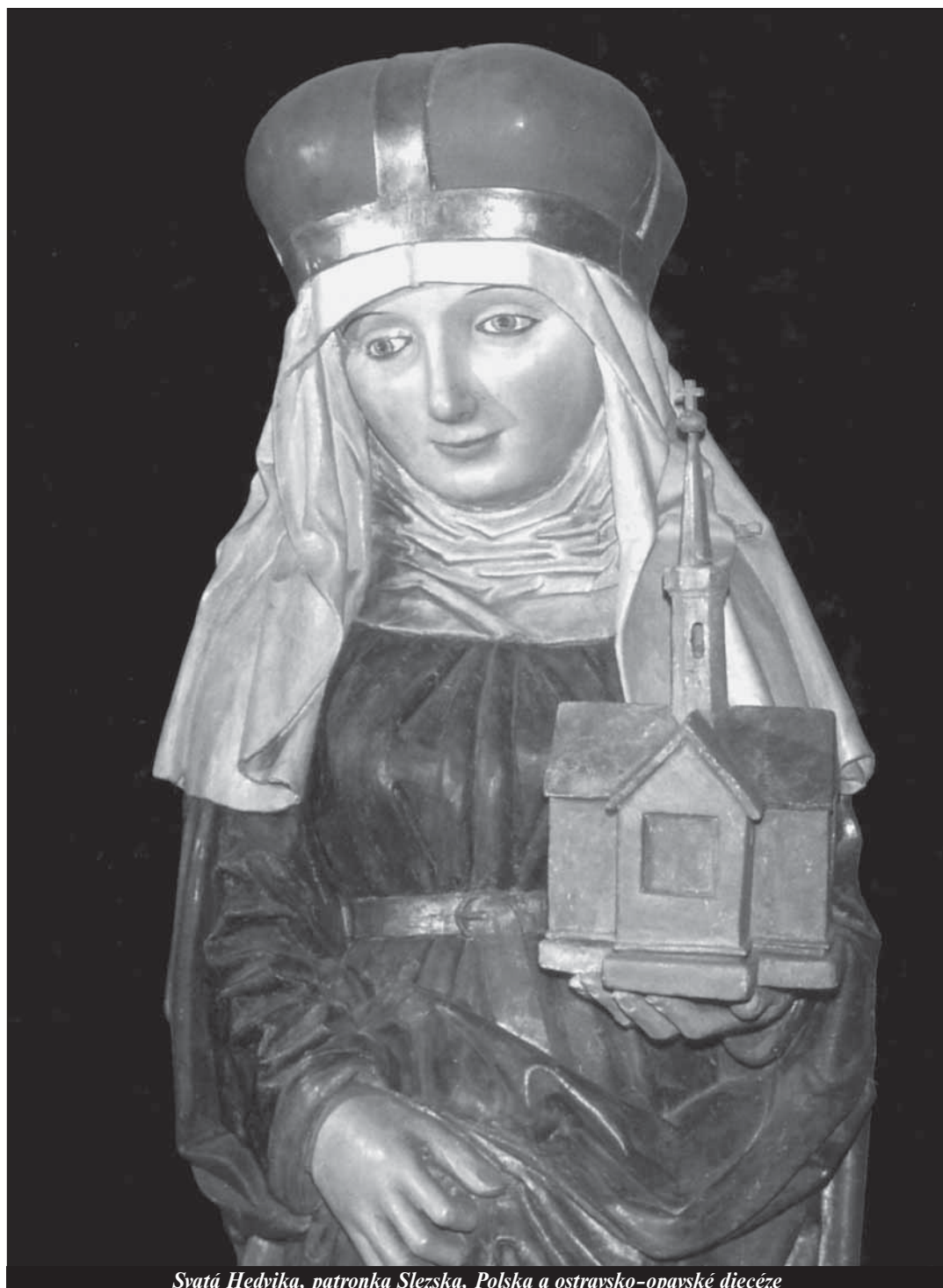
Svatá Hedvika, patronka Slezska, Polska a ostravsko-opavské diecéze

INFORMACE O PŘEDPLATNÉM SVĚTLA NA ROK 2006 V TOMTO ČÍSLE NA STR. 16