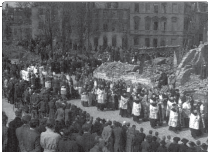
Pohřební průvod se zesnulým biskupem von Galenem prochází troskami Münsteru

Význam těchto dopisů ještě více vynikne, když uvážíme, v jakém kontextu vznikly. Dopisy von Galenovi jsou součástí corpusu 124 listů, které Pius XII. napsal německým biskupům v období 1939–1944. Důvod této korespondence vysvětlil Pius XII. v březnu 1939 německým kardinálům, kteří se sešli na konkláve, aby ho zvolili papežem. Po konkláve prodloužili kardinálové svůj pobyt v Římě, aby s novým papežem prohodili situaci v Německu, kterou papež sledoval z bezprostřední blízkosti nejdříve jako nuncius a pak jako státní sekretář. Řekl jim: „Německá otázka je pro mně ta