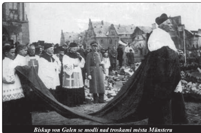
Biskup von Galen se modlí nad troskami města Münsteru