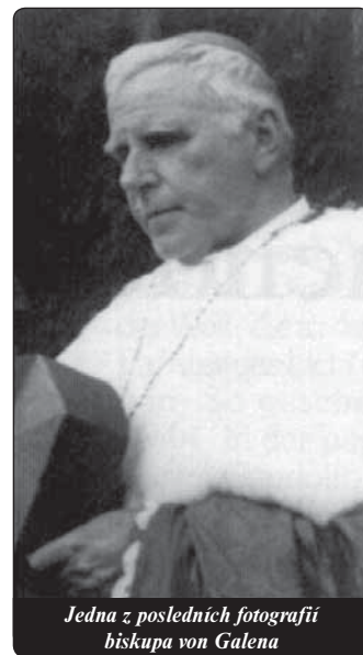
Jedna z posledních fotografií biskupa von Galena

Dominikán A. Eszer, relátor procesu blahořečení, uvedl: „Boj, který biskup von Galen vedl proti těm, které pokládal za nepřátele Církve, ukazuje jednoznačně, že tento služeb-