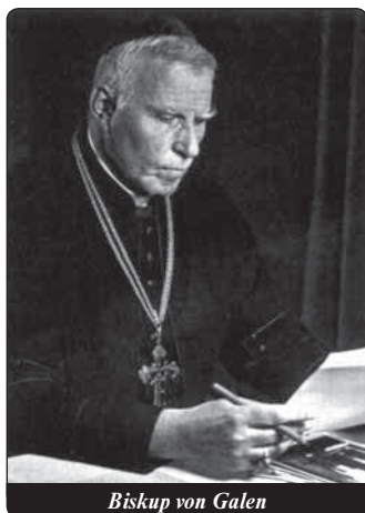
Biskup von Galen

Toto první kázání se neminulo účinkem. A při druhém 20. července byla katedrála plná do posledního místa. Lidé přicházeli z daleka, aby slyšeli jeho řeč. Von Galen otevřel lidem oči, aby viděli, jak nesmyslný je plán režimu, který chce uvrhnout zemi do bídy, a hlásal: „Společensví s muži, kteří chtějí naše řeholníky, naše bratry a sestry bez právního podkladu vyštvať ze země jako divokou zvěř. Ne! S nimi a především s těmi, kteří jsou za to odpovědvní, nedo-