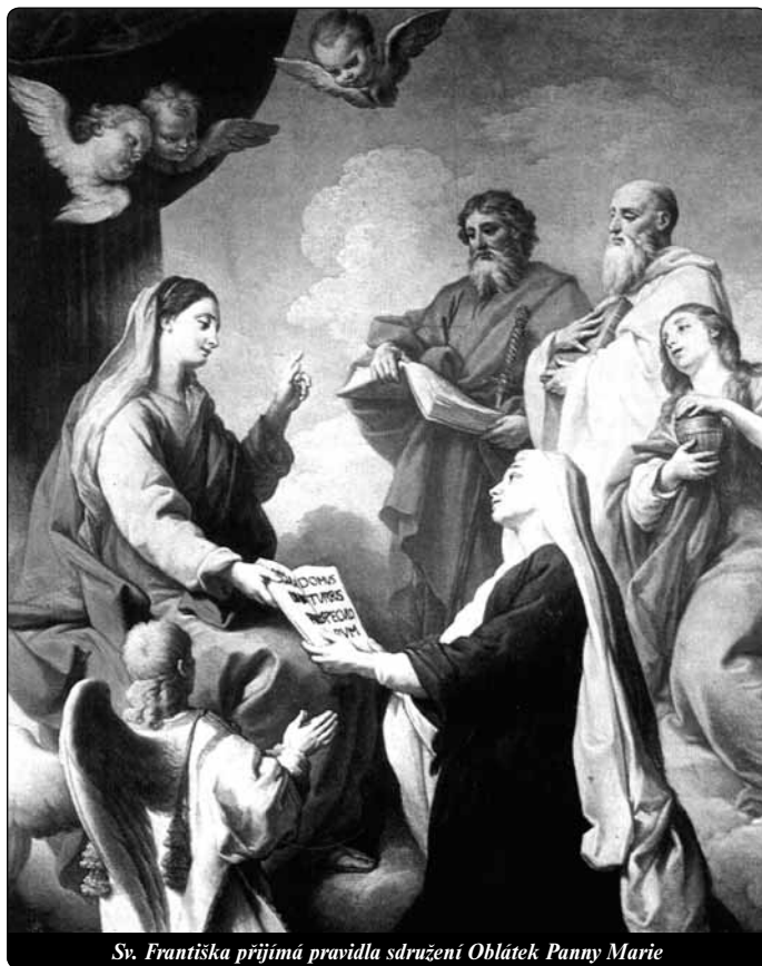
Sv. Františka přijímá pravidla sdružení Oblátek Panny Marie