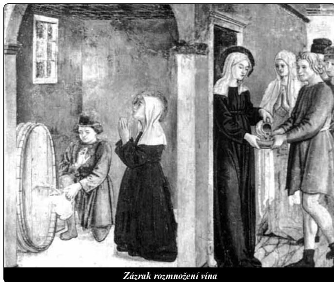
Zázrak rozmnožení vína