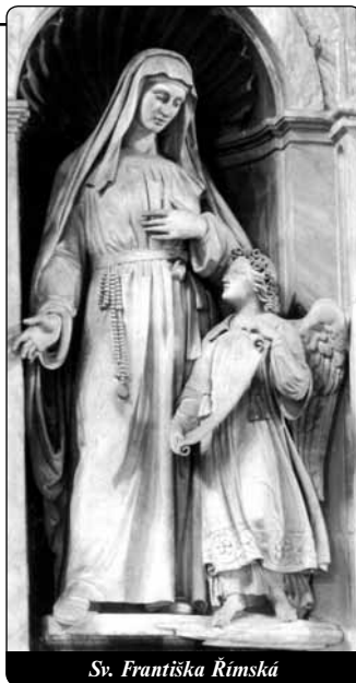
Sv. Františka Římská