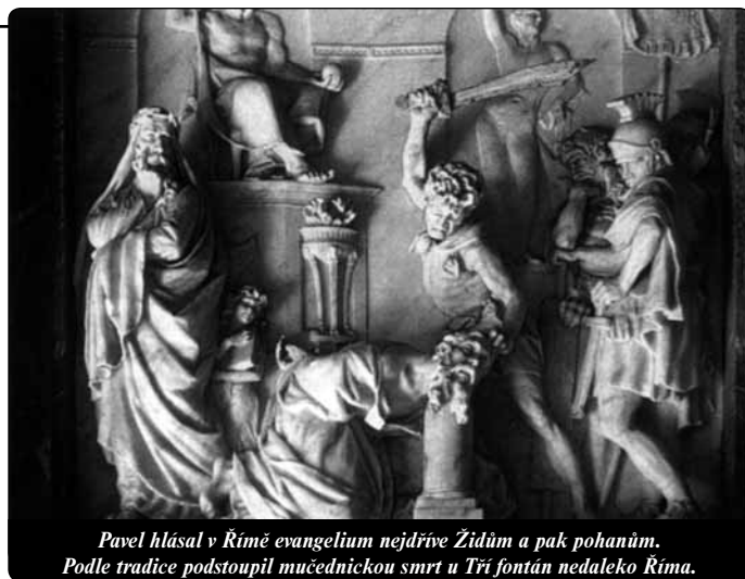
Pavel hlásal v Římě evangelium nejdříve Židům a pak pohanům. Podle tradice podstoupil mučednickou smrt u Tří fontán nedaleko Říma.

vel řekl: Vyzývám vás, abyste něco snědli. To je nutné, abyste se mohli zachránit. Nikdo z vás nepřijde ani o vlas na hlavě. Po těch slovech vzal chléb, přede všemi vzdal Bohu díky, rozlámal ho a začal jíst. To všechny vzpružilo a také něco snědli (v. 34-35).