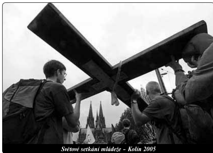
Světové setkání mládeže – Kolín 2005

Vraťme se ještě jednou k Poslední večeři. To nové, co se zde událo, leží v nové hloubce staré izraelské modlitby žehnání, která se nyní stává slovem proměnění a daruje nám účast na hodině Kristově. Ježíš nám neuložil opakovat paschální večeři. To je také výroční slavnost, kterou není možno libovolně opakovat. On nám uložil, abychom vstoupili do jeho hodiny . Do ní vstupujeme skrze slovo svaté moci proměňování, které se uskutečňuje skrze modlitbu chvály a ta nás stává do kontinuity s Izraelem a s celými dějinami Boží spásy a současně nám daruje to nové, na co tato modlitba vnitřně čekala. Tato modlitba – církev ji nazývá Eucharistická modlitba – tvoří Eucharistii. Je to slovo moci, která dary země proměňuje zcela novým způsobem v sebedarování Boha a nás vtahuje do tohoto procesu proměňování. Proto toto dění nazýváme Eucharistie, což je překlad řeckého