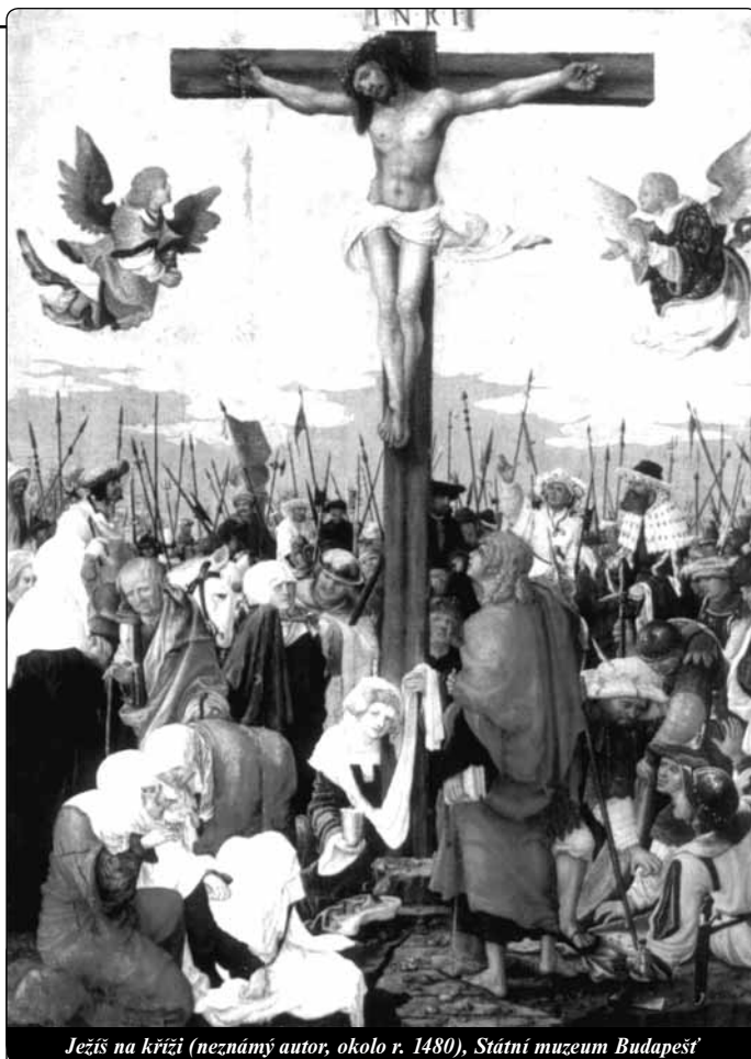
Ježíš na kříži (neznámý autor, okolo r. 1480), Státní muzeum Budapešť