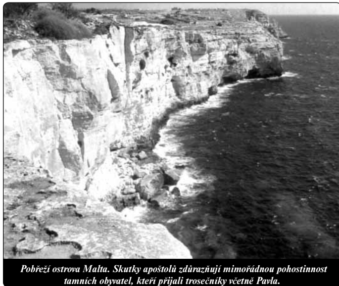
Pobřeží ostrova Malta. Skutky apoštolů zdůrazňují mimořádnou pohostinnost tamních obyvatel, kteří přijali trosečníky včetně Pavla.

V jednom okamžiku, když námořníci cítili, že země je blízko, chtěli z lodi utéci. Pavel na to upozornil velitele. Proto vojáci usekli provazy od připraveného záchranného člunu a nechali ho odplout. Čtrnáctého dne Pa-