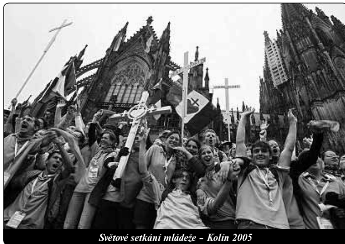
Světové setkání mládeže - Kolín 2005

Blahoslavení a svatí byli lidé, kteří nehleděli zoufale jen na své vlastní štěstí, nýbrž prostě chtěli dát sami sebe, protože byli