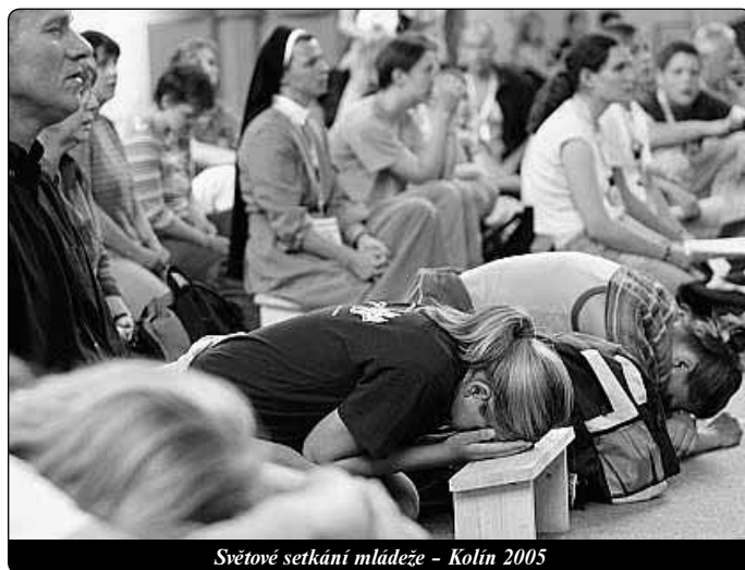
Světové setkání mládeže - Kolín 2005

Když se na horizontu života objeví tato odpověď, milí přátelé, je nutno udělat nezbytná rozhodnutí. Je to jako když se člověk nachází na rozcestí: Kterou cestou mám vyrazit? Tou, ke které přemlouvají vášně, nebo tou, kterou ukazuje hvězda, která svítí ve svědomí? Když Hvězdopravci slyšeli odpověď: V Betlémě judském, neboť tak to stojí u Proroků (Mt 2,5), rozhodli se, osvěcení tímto světlem, pokračovat v cestě až k cíli. Z Jeruzaléma šli do Betléma, to znamená od slova, které jim ukázalo, kde je král, kterého hledali, až k setkání s tímto králem, který je současně Beránek Boží, který snímá hříchy světa. Toto slovo je určeno také nám. I my musíme učinit svou volbu. Ve skutečnosti to znamená, správně uváženo, přesně totéž, co prožíváme při účasti na každé eucharistické slavnosti. V každé mši svaté vede nás totiž setkání s Božím slovem k účasti na tajemství kříže a zmrtvýchvstání Krista, a tak k eucharistické hostině, k sjednocení s Kristem. Na oltáři je přítomen ten, kterého viděli Hvězdopravci ležet na seně: Kristus, živý Chléb, který z nebe sestoupil, aby dal světu život, pravý Beránek, který dává svůj život za spásu lidstva. Osvícení slovem můžeme – opět v Betlémě, „Domě chleba“ – prožít zážitek uchvacujícího setkání s nepochopitelnou velikostí Boha,