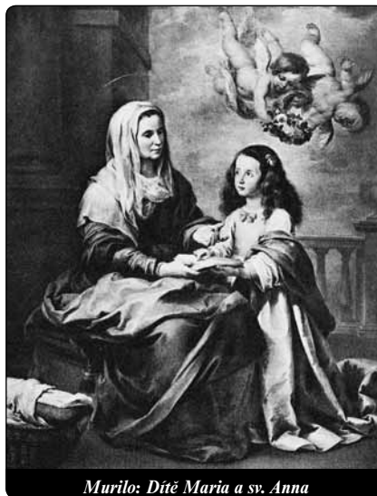
Murilo: Dítě Maria a sv. Anna