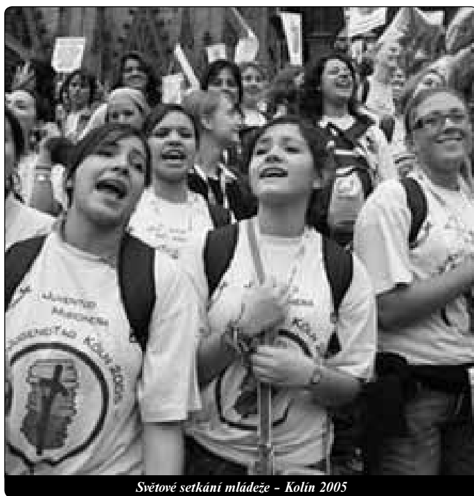
Světové setkání mládeže - Kolín 2005