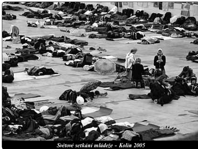
Světové setkání mládeže - Kolín 2005

Jděme vpřed s Kristem a žijme svůj život jako praví Boží citelé.