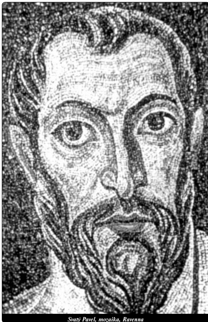
Svatý Pavel, mozaika, Ravenna

ji všichni židé... jen kdyby chtěli svědčit... A teď stojím před soudem, protože doufám ve vyplnění toho, co Bůh našim otcům zaslíbil. Našich dvanáct kmenů doufá, že toho dosáhnou vytrvalou služ-