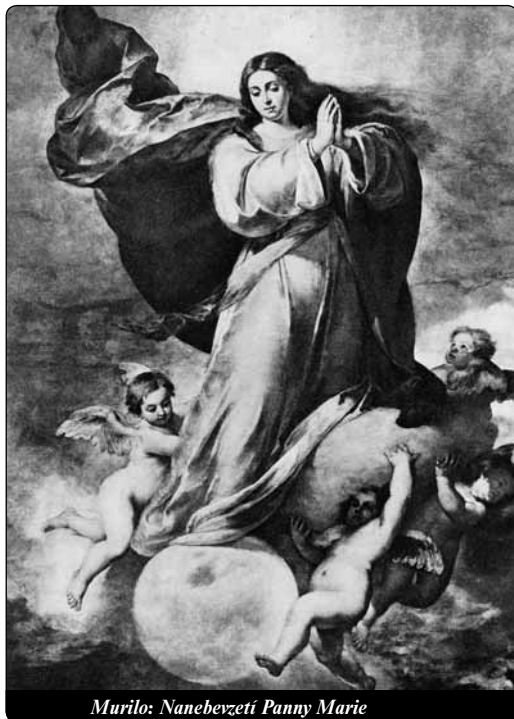
Murilo: Nanebevzetí Panny Marie

roda, a dodal, že národy bez dětí jsou národy bez budoucnosti. Jde tedy o téma výsostně aktuální. Týká se všech evropských národů, které jsou ohroženy vymíráním, a náš národ je, jak víme, někde na čele.