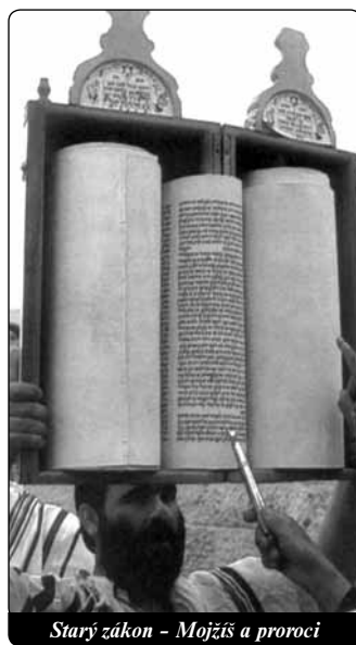
Starý zákon - Mojžiš a proroci

26,1-8: Můj život od mládí, jaký jsem vedl od začátku, zna-