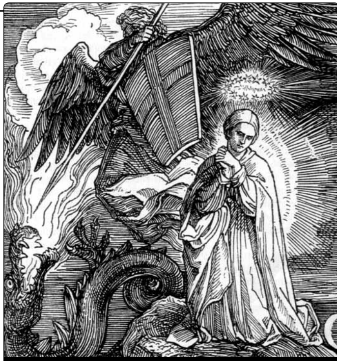
„A ukázalo se veliké znamení na nebi: Žena oděná sluncem, s měsícem pod nohama a s korunou z dvanácti hvězd kolem hlavy.“ (Zj 12,1)

Je islám pro Evropany atraktivní? Zatím mnoho Evropanů cítí odpor k právnímu a bojovnému islámu. Naproti tomu náboženský islám a jeho kultura, zvláště sufismus, se těší u některých Evropanů nemalým sympatiím. Islám se jeví atraktivní pro všechny lidi, kteří odmítají křesťanství jako učení o trojjediném Bohu, o ztracení hříšníků a o smíření v Kristu a současně hledají nějakou tzv. spiritualitu. Islám má dlouhou „spirituální“ tradici a lidi, kteří chtějí nějakou obecnou víru v Boha a osobní religiozitu, může islám velice dobře obsloužit. Bohužel nemůžeme přehlížet, že určitá křesťanská teologie, který redukuje křesťanskou