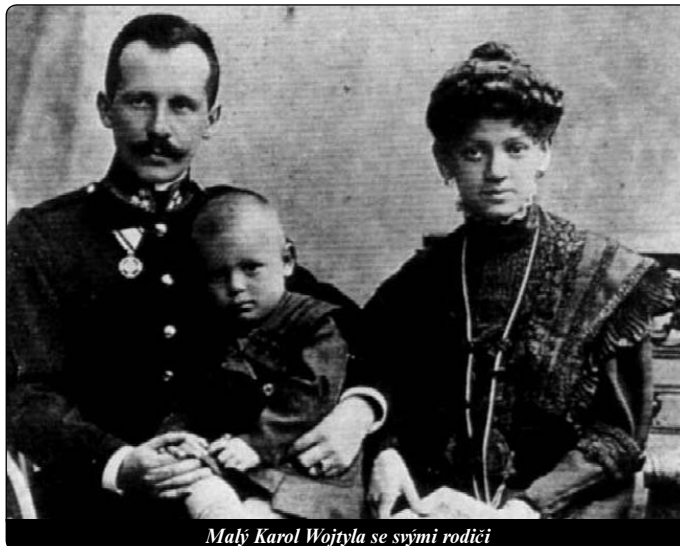
Malý Karol Wojtyła se svými rodiči

pení, které s sebou vlácel tento Kristův náměstek až do posledního okamžiku svého života, aby tak doplňoval, co chybí do plné míry Kristova utrpení. Z takřka zcela ochrnulého starce stále vyzářovala mladistvá horoucí láska k Spasiteli a touto láskou objímal každého člověka, především pak trpící a strádající. Jedna z posledních jeho fotografií nám zachovala jeho podobu, jak během křížové cesty na Velký pátek, na