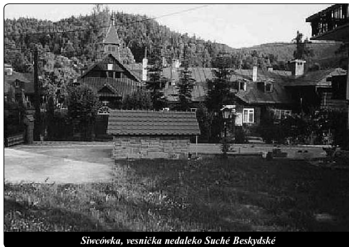
Siwcówka, vesnička nedaleko Suché Beskydské

To, co je nejtěžší, zadostiučnění Boží spravedlnosti, splnil Pán skrze svůj kříž, a teď už je třeba jen z něho čerpat. Je třeba jen dobré vůle, a jediným úkonem lítosti je možno získat svatost (K 129).