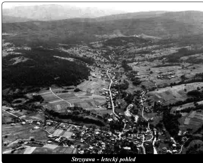
Stryszawa - letecký pohled

Zápisky o duchovních zážitcích Kunhuty začaly vznikat v roce 1942. Tehdy Evropa hynula pod břemenem druhé světové války. Zlé zprávy docházely i do Siwcowky. Nejednou prosili Kunhutu o přímlovu, ale stávalo se, že i ona podléhala panice. Její Milovaný ji tehdy káral a připomínal jí, aby zachovala klid duše, protože válečné zprávy nepotřebuje ke své spásě. Bud' pokojného ducha a nezatežuj se starostmi (K 47). Ujišťoval ji, že vyslyšel její prosby za záchranu Siwcowky. Bud'te klidní, zde nebude žádné nebezpečí. Tady je místo mého milosrdenství. Bude se sem vracet mnoho lidí, kteří se