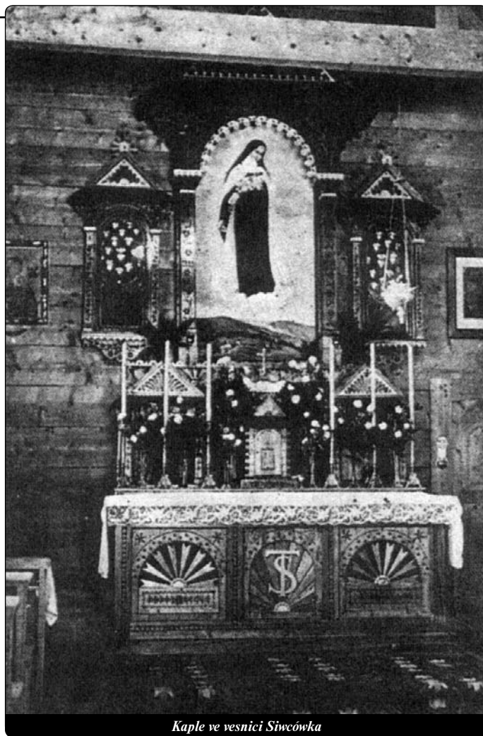
Kaple ve vesnici Siwcówka

Pán Ježíš měl pro Kunhutu jinou cestu: Půjdeš cestou duchov-