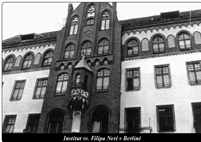
Institut sv. Filipa Neri v Berlíně