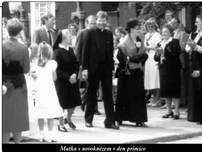
Matka s novoknězem v den přímice

„V té době matka právě odovdělala a my děti jsme jeden po druhém odešli z domu. A tak jsem v době studia v semináři vždy po několika týdnech pravidelně přicházel domů. Byli jsme s matkou ve velmi důvěrném vztahu. Vždy jsme se modlili růženec a amsterodamskou modlitbu. V semináři jsem četl poselství Matky všech národů a v nitru jsem záhy pochopil jejich význam a hloubku. Po kněžském svěcení 9. června 1979 jsem nastoupil jako kaplan do farnosti sv. Martina v Beeku nedaleko Maastrichtu. Když jsem potom od roku 1980 studoval v Německu v Augšpurku a stal jsem kaplanem ve farnosti sv. Petra a Pavla, zatelefonovala mi jednoho dne moje matka. Vysvětlila mi, že prodala svůj dům v Brabantu, kde tehdy žila, a že chce nyní uskutečnit svůj velký sen: otevřít dům pro kněze a tam se o ně starat jako matka. Byla to velmi podnikavá žena plná důvěry. Ale kde jsme měli pro ni najít do měsíce dům? Nakonec měla zůstat na ulici a mně se podařilo ubytovat ji ve farnosti jednoho přítele v Heerlenu. V roce 1985 jsem tam byl sám jmenován děkanem a současně docentem v kněžském semináři. Jaké nečekané Boží řízení! Z počátku jsme bydleli od sebe pouhých 100 m a později se samozřejmě maminka přestěhovala ke mně na faru. Teď měla skutečně dům pro kněze, protože k nám mnozí stále přicházeli.“