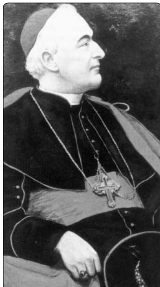
Kardinál Vaughan. V jeho biskupském znaku je heslo: „Milovat a sloužit!“ Kardinál sám tlumočil toto heslo takto: „Tato dvě slova vyjadřují můj program: Láska musí být kořenem, ze kterého vyrůstá všechna moje služba.“